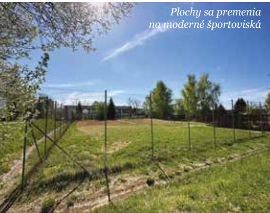
Plochy sa premenia na moderné športoviská