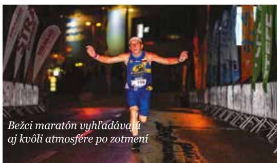
Bežci maratón vyhľadávajú aj kvôli atmosfére po zotmení

jazdy naň zo susediacich vnútroblokov. Ulica na Troskách od malého po veľký kruhový objazd bude uzavretá už od 13:00 hod. Výluka bude realizovaná v spolupráci s políciou a mestskou políciou, vodiči budú navádzaní na obchádzkové trasy. Spoje MHD dotknuté uzávierkou uvedených komunikácií budú premávať po obchádzkových trasách podľa náhradného grafikonu. Organizátori pozývajú všetkých, aby prišli podporiť tento športový sviatok. Všetky podstatné informácie a online registráciu nájdete na stránke www.marathonbb.com .