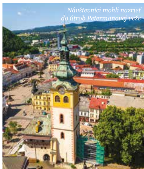
Návštevníci mohli nazrieť do útrob Petermanovej veže

Oficiálne otvorenie podujatia sa uskutoční v piatok o 18:00 hod. na Námestí SNP za zvuku tradičnej klopačky. Ešte predtým, od 17:00 hod., atmosféru dotvorí Mestský dychový orchester z poľského partnerského mesta Tar-