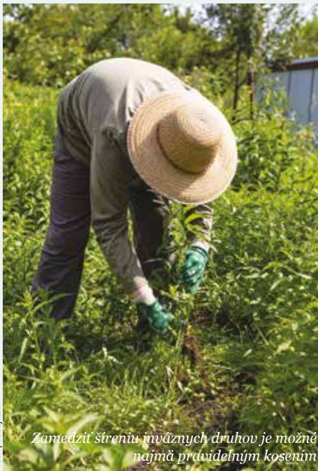
Zamedziť šíreniu invázných druhov je možné najmä pravidelným kosením

vlastník pozemku. Mesto Banská Bystrica sa usiluje o minimalizovanie invázných rastlín na svojom území. Údržbu mestských pozemkov vrátane likvidácie invázných rastlín má v kompetencii mestská príspevková organizácia Záhradnícke a rekreačné služby