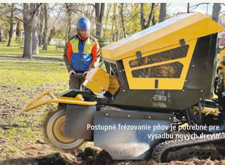
Postupné frézovanie pňov je potrebné pre výsadbu nových drevín