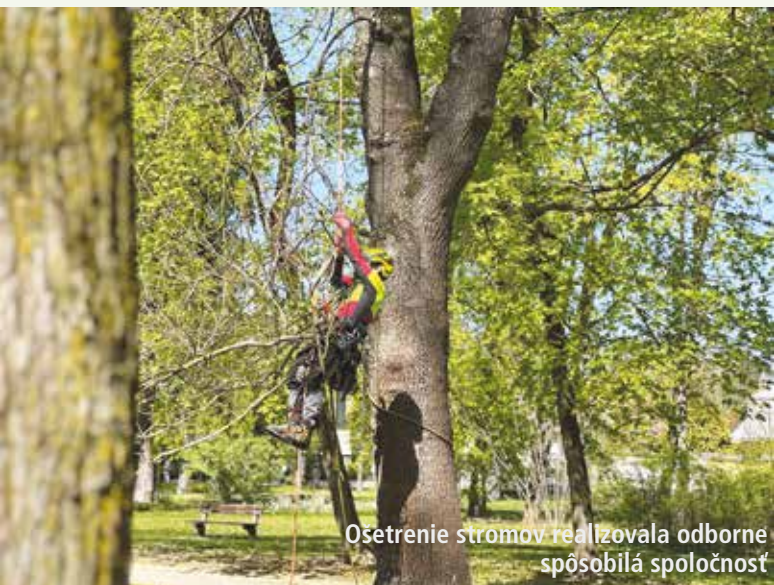
Ošetrenie stromov realizovala odborne spôsobilá spoločnosť