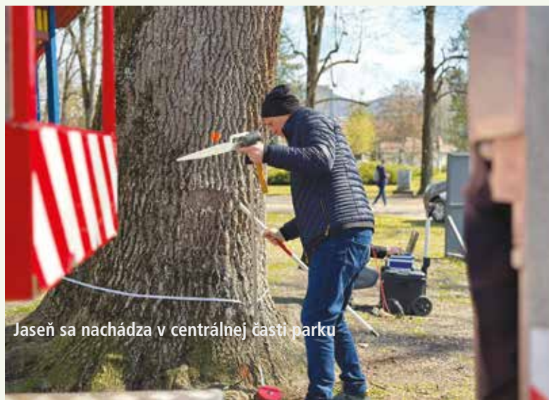
Jaseň sa nachádza v centrálnej časti parku

V prvej etape bude vysadených 143 kusov stromov a presadených 34 kusov stromov. V rámci prvej etapy sa počíta s výsadbou drevín v širšej kruhovej časti parku, doplnením