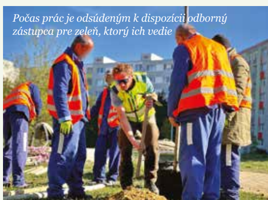
Počas prác je odsúdeným k dispozícii odborný zástupca pre zeleň, ktorý ich vedie