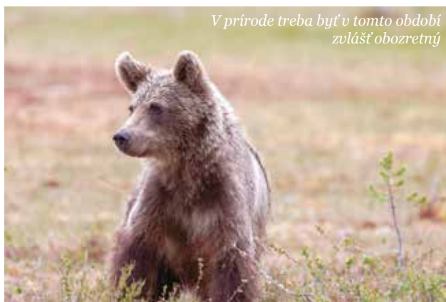
V prírode treba byť v tomto období zvlášť obozretný