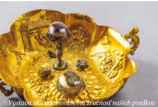
Výstava ukazuje remeselnú zručnosť našich predkov

Medený príbeh Banskej Bystrice pokračuje aspoň symbolicky. Do mesta sa vrátili vzácne medené platne z potopenej lode a najnovšie si môžu návštevníci v Barbakáne pozrieť ďalší unikát – jedinečnú zbierku španodolinských nádob s fascinujúcim príbehom.