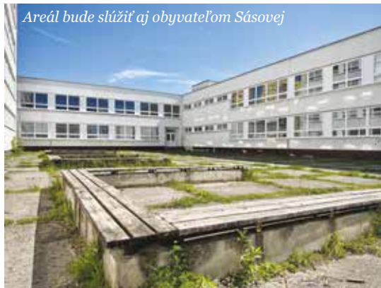
Areál bude slúžiť aj obyvateľom Sásovej