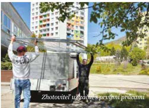
Zhotoviteľ už začal s prvými prácami

Na mieste existujúcich plôch vzniknú dve multifunkčné ihriská, jedno s umelou trávou a druhé s moderným EPDM povrchom. Obe budú slúžiť na viacero športov, ako volejbal, nohejbal, tenis či futbal, a budú vybavené mantinelmi, oplatením aj brámkami. Pribudne tiež atletická rovinka so štyrmi dráhami a doskočiskom do piesku, pričom povrch bude tvoriť umelý športový materiál Tartan. V ďalšej časti areálu vznikne nové basketbalové ihrisko s EPDM povrchom na existujúcej asfaltovej ploche. „Som veľmi rada, že sa nám podarilo začať s prvou etapou rekonštrukcie našej školy. Začíname športoviskami, ktoré skvalitnia výchovno-vzdelávací proces, ale môžu ich využívať aj obyvatelia Sásovej. Záro-