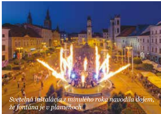
Svetelná inštalácia z minulého roka navodila dojem, že fontána je v plameňoch

Program odštartuje v piatok dopoludnia, pričom informačným kompasom pre návštevníkov bude stánok na Námestí SNP. Veľkým lákadlom je výstava vzácných baníckych insígnií – renesančný kalich z roku 1574, baroková monštrancia s baníckymi insígniami z druhej polovice 17. storočia a historické banícke kladivká. Insígnie budú vystavené v sprístupnenom podzemí biskupského paláca. V týchto autentických priestoroch si návštevníci pozrú zároveň umelecké predmety zo zbierok biskupstva Banskej Bystrice a tiež tu bude inštalovaná výstava, ktorá odprezentuje 250. výročie založenia banskobystrickej diecézy. V THURZO – FUGGER zážitkovej expozícii bude zároveň sprístupnená výstava Červené zlato – zrodené z vody a ohňa, ktorá prezentuje fascinujúci príbeh premeny železa na meď, baníckej tradície a jedinečných umeleckých diel – španodolinských nádob a hanštajnov (viac o výstave sa dočítate na strane 7.). Súčasne sa v Starej tržnici rozbehne festival Chill & Grow zameraný na rozvojové prí-