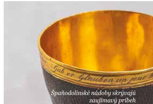
Španodolinské nádoby skrývajú zaujímavý príbeh

Cieľom tejto výstavy je poukázať aj na spôsob získavania medi, ktorý síce nebol úplnou raritou, no len málokto si dnes dokáže predstaviť ťažbu medi prostredníctvom transmutácie kovov. Alchymistické procesy sa v minulosti spájali s legendami a mystikou, preto takto vyťažaná meď získala prezývku zázrak z Herrengundu, podľa historického názvu Španej Doliny. Transformácia železa na meď v cementačných vodách fascinovala celú generáciu a dodnes v sebe nesie symboliku premeny, a to nielen materiálu, ale aj ľudskej práce na hodnotu, ktorá pretrváva stáročia.