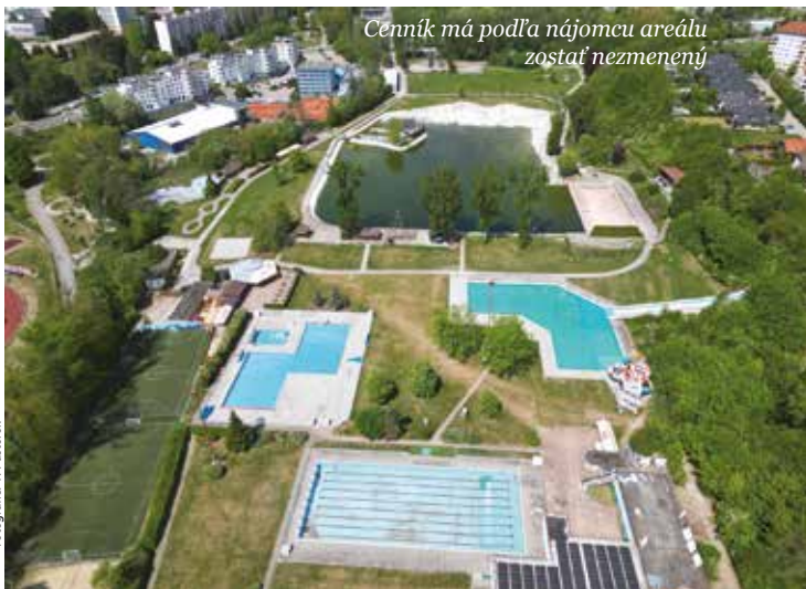
Cenník má podľa nájomcu areálu zostať nezmenený