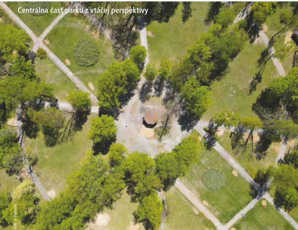
Centrálne časti parku z vtáčej perspektívy

V Mestskom parku na Tajovského ulici sa v uplynulých mesiacoch realizoval hydrogeologický prieskum a nevyhnutné výrubu nebezpečných drevín. Nasledovalo frézovanie pňov, dočisťovanie a pokračuje sa s ošetrovaním drevín. Park by mal byť otvorený už v najbližších týždňoch a výsadba nových stromov sa začne na jeseň tohto roka.