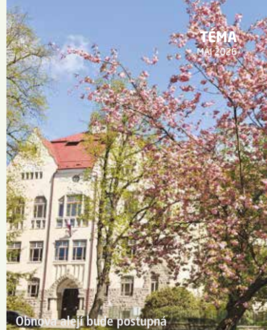
Obnova alejí bude postupná