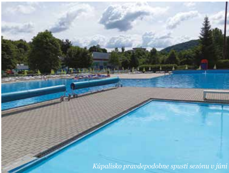
Kúpalisko pravdepodobne spustí sezónu v júni

Prostredníctvom pracovnej skupiny, v spolupráci s petičným výborom a predsedami poslaneckých klubov, samospráva dohliada na plnenie zmluvných povinností nájomcu a zároveň presadzuje realizáciu opatrení vedúcich k celkovému zlepšeniu stavu tohto jedinečného verejného priestoru. V piatok 15. mája 2026 sa uskutočnila prvá tohtoročná komplexná obhliadka kúpaliska pred spustením letnej sezóny, a to za účasti všetkých zainteresovaných strán. O výsledkoch kontroly budeme čitateľov informovať v nadchádzajúcom vydaní Radničných novín. Vďaka opakovaným kontrolám plážového kúpaliska a pripomienkam zo strany pracovnej skupiny, zástupcov petície, predsedov poslaneckých klubov aj verej-