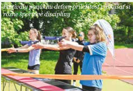
Festivaly ponúknu deťom príležitosť vyskúšať si rôzne športové disciplíny

Festivaly budú tradične rozdelené podľa vekových kategórií. Žiaci II. stupňa základných škôl sa stretnú 27. mája 2026 v športovom areáli Základnej školy s materskou školou Radvanská. Čakať ich budú atletické disciplíny inšpirované olympijskými športmi – beh na 60 a 800 metrov, štafeta 4 × 250 metrov či skok do diaľky. Chlapci a dievčatá z 5. až 9. ročníka si zmerajú sily aj v basketbale, vybíjanej, malom futbale, florbale a v modernej disciplíne Laser Run, ktorá si získava čoraz