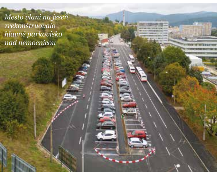
Mesto vlani na jeseň zrekonštruovalo hlavné parkovisko nad nemocnicou