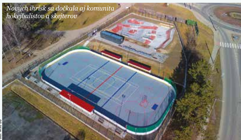
Nových ihrísk sa dočkala aj komunita hokejbalistov a skaterov