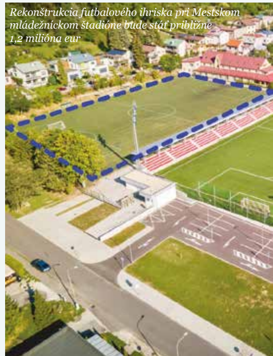
Rekonštrukcia futbalového ihriska pri Mestskom mládežníckom štadióne bude stáť približne 1,2 milióna eur