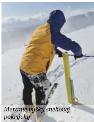
Meranie výšky snehovej pokrývky

cou, zistíme, že napríklad za posledných päť rokov len v roku 2022 bol zaznamenaný významný nedostatok zrážok. Ostatné roky, pokiaľ ide o množstvo zrážok, boli v povodí zrážkovo normálne až nadnormálne. Počas jednotlivých rokov však zrážky neboli rozdelené rovnomerne, ale vyskytovali sa mesiace s výrazným nadbytkom, ako v máji 2021, či na prelome rokov 2023 a 2024, alebo deficitom zrážok, povedzme leto 2022, poprípade v závere roka 2024. Rovnako to platí aj pre ich rozdelenie v priestore. Sú lokality, kde spadlo počas roka viacej zrážok, a lokality, kde bolo zrážok menej. Problémom nie je až tak množstvo zrážok, ale skôr ich rozdelenie v priestore a čase, teda častejší výskyt extrémov, ako napríklad dlhšie periódy bez zrážok či krátke príválové lejaky, kedy za krátke čas spadne a z krajiny odtече veľké množstvo zrážok. V posledných rokoch sa často stretávame aj s ďalším fenoménom, ktorý ide na vrub prebiehajúcej klimatickej zmeny, a to sú nadpriemerne teplé zimné mesiace. Ak je zima bohatá na zrážky, tie sa potom vyskytujú prevažne v kvapalnej forme a neakumulujú sa v snehovej pokrývke. Iba ak v najvyšších horských polohách. Kvapalné zrážky odtekajú z krajiny a pri dostatočnom množstve môžu v podhorských oblastiach aj v zimných mesiacoch vytvárať nebezpečné povodňové situácie.