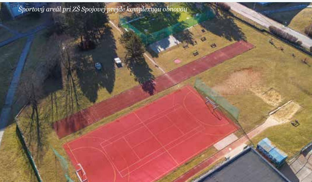
Športový areál pri ZŠ Spojovej prejde komplexnou obnovou

Základná škola Pieninská je zapojená do mnohých športových projektov ako je Abeceda športu, Tenis do škôl či Zober loptu, nie drogy. Aj najmenší prváci sa venujú rôznym druhom športov pod odborným vedením pedagógov. „Práve rekonštrukcia multifunkčného ihriska bude veľkým prínosom k ochrane zdravia žiakov, nakoľko povrch športoviska, ktoré