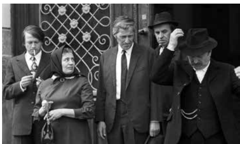
Jedna z mála fotografií zachytávajúca Jozefa Kronera počas filmovania v Banskej Bystrici