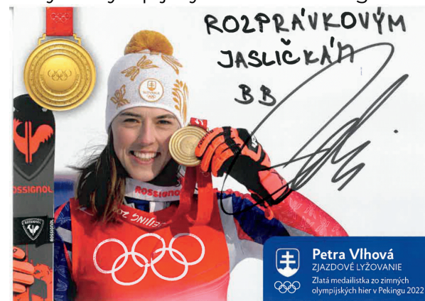
Petra Vlhová ZJAZDOVÉ LYŽOVANIE Zlatá medailistka zo zimných olympijských hier v Pekingu 2022

Jedného dňa nás príjemne prekvapil pozdrav od Petry Vlhovej – zlatej medailistky zo zimných olympijských hier v Pekingu 2022, ktorá nám poslala podpis kartu s originálnym venovaním a autogramom. Peťa, prajeme Ti veľa športových úspechov, Jasličkári z Banskej Bystrice.