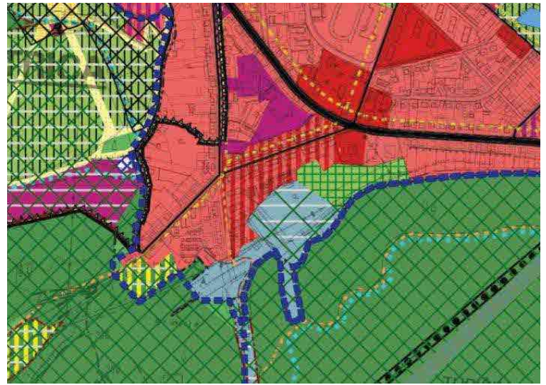
VÝKRES č.3a PRIESTOROVÉ USPORIADANIE A FUNKČNÉ VYUŽITIE ÚZEMIA VÝREZ Z PLATNÉHO ÚPN M BANSKÁ BYSTRICA