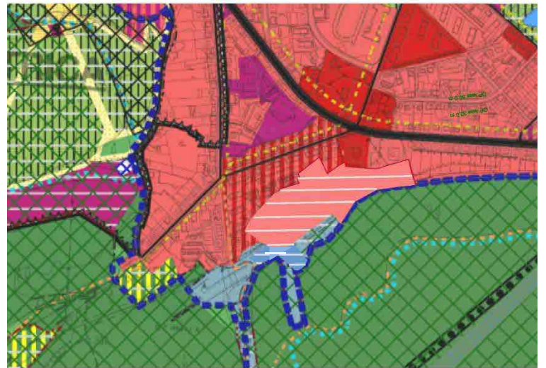
VÝKRES č.3a PRIESTOROVÉ USPORIADANIE A FUNKČNÉ VYUŽITIE ÚZEMIA NÁVRH ZMIEN A DOPLNKOV