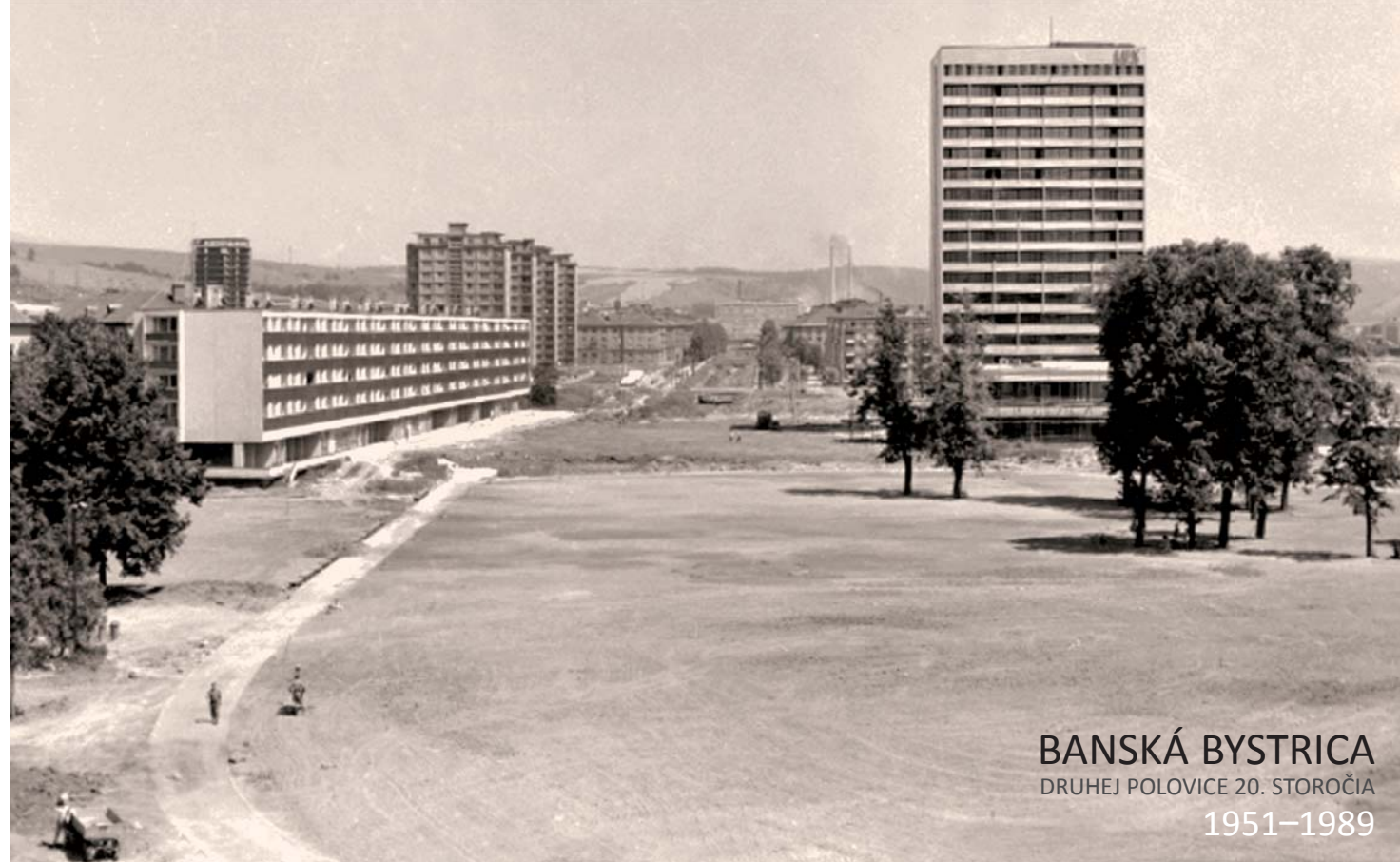
BANSKÁ BYSTRICA DRUHEJ POLOVICE 20. STOROČIA 1951–1989

Politický a spoločenský význam Banskej Bystrice v druhej polovici 20. storočia sa zakladá, okrem iného, aj na historickom fakte, že počas II. svetovej vojny tu bolo centrum Slovenského národného povstania. Po oslobodení sa Banská Bystrica stáva krajským mestom, jedným z troch hospodársko-správnych centier Slovenska. Od päťdesiatych rokov mesto preživa v rámci socialistickej výstavby podobný vývoj ako ostatné mestá na Slovensku. Rekonštruujú a modernizujú sa existujúce továrne, stavajú sa nové výrobné podniky. Okrem stavebníctva sa dynamicky rozvíjajú aj ďalšie odvetvia hospodárstva: obchod, doprava, miestne hospodárstvo, služby.