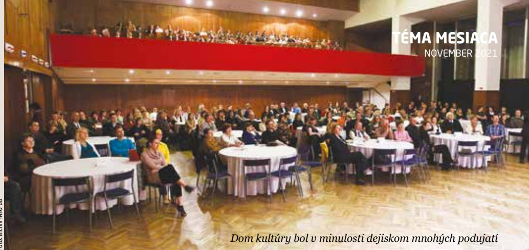
Dom kultúry bol v minulosti dejiskom mnohých podujatí

Budova Domu kultúry je päťpodlažná, s jedným podzemným podlažím a štyrmi výškovo