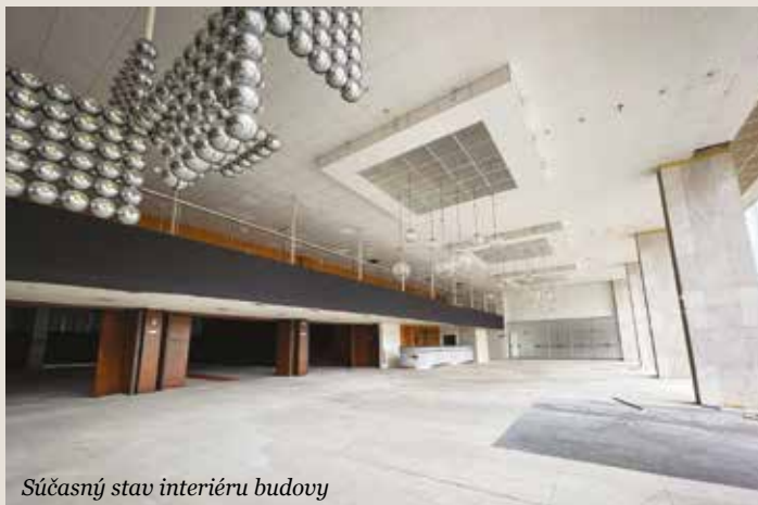
Súčasný stav interiéru budovy

Mesto Banská Bystrica má v budúcnosti záujem prevádzkovať najmä kultúrno-spoločenskú estrádnú sálu a k nej prislúchajúce zázemie, ktoré by bolo využívané na organizovanie kultúrnych podujatí. Ďalšie časti objektu, ako komorné divadlo, kinosála i administratívne priestory, by v prípade úspešnej kúpy patrili Banskobystrickému samosprávnemu kraju. „Radi by sme tu videli naše Bábkové divadlo na rázcestí, ktoré dnes sídli v historickej budove, ktorá veľmi limituje jeho ďalší rozvoj i komfort návštevníkov. Rovnako sú tu vhodné priestory pre zriadenie populárno-vedeckého centra zameraného na astronómiu a vesmír, s ktorým sme pôvodne uvažovali na Kačici, ale tieto priestory by preň boli vhodnejšie. Rozšíriť by sme vďaka tejto investícii vedeli aj už existujúce regionálne centrum inovácií InnoLabb a z prenatých priestorov by sa sem mohli presťahovať neďaleké pobočky Verejnej