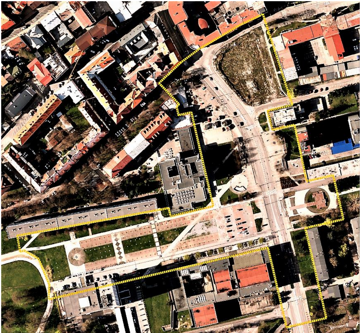
Hranica riešeného územia