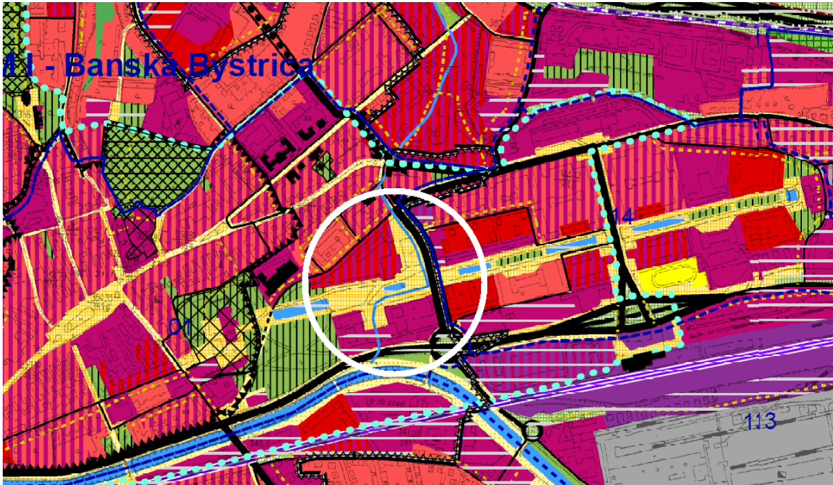
Riešené územie vyznačené vo výreze z ÚPN-M

2. Cieľmi je vyriešenie priestorových a funkčných problémov, povýšenie a podporenie významu hlavnej kompozičnej osi vedenej v smere východ – západ a vrcholiacej pamätníkom SNP. Vážnym problémom riešeného územia sú tiež urbanisticko-dopravné problémy a dopravná obsluha. Podrobne sú požiadavky a problémy uvedené v kapitolách 7. Predmet súťaže a 8. Požiadavky na riešenie.