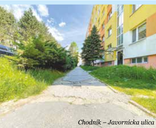
Chodník – Javornícka ulica