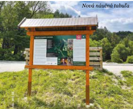
Nová náučná tabuľa

Oblasť Laskomera má viacero miest a javov, ktoré stoja za pozornosť. Nachádzajú sa tu obľúbené cyklistické singletraily - špeciálne cyklotrasy určené pre adrenalinové horské jazdy s prirodzenými aj dobudovanými prekážkami. Na svoje si však prídu aj peší turisti, ktorí si môžu vybrať hneď z niekoľkých trás. Nechýba nádherná príroda či atraktívne výhľady na mesto a okolité pohoria. Prechádzku v tejto lokalite teraz môžete spojiť aj s poznávaním.