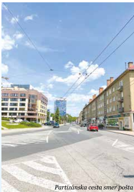
Partizánska cesta smer pošta