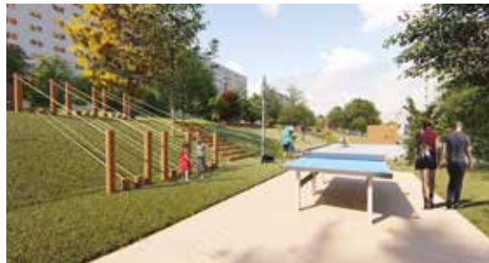
Vizuálna architektúra: archív MŠÚ BB

Práce na vnútrobloku medzi Tatranskou a Sitnianskou ulicou v Sásovej sú už v plnom prúde. Zároveň samospráva hľadá zhotoviteľa na rekonštrukciu vnútrobloku medzi Tulsou ulicou, Moskovskou ulicou a Kyjevským námestím s rozlohou 14 000 metrov štvorcových. Ak bude priebeh verejného obstarávania bez problémov, so stavebnými prácami by sa mohlo začať už toto leto.