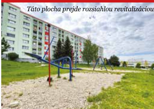
Táto plocha prejde rozsiahlou revitalizáciou