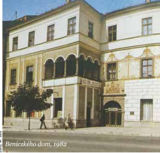
Beniczského dom, 1982

til do Bratislavy, od roku 1981 sa stal najprv externým, neskôr interným pedagógom na katedre reštaurovania VŠVU, habilitoval sa na docenta a vychoval desiatky poslucháčov v odbore reštaurovania. Od roku 1997 bol riadny vysokoškolský profesor s dekrétom od prezidenta Michala Kováča. Vo svojej profesii patril k priekopníckej generácii. Aj po odchode do dôchodku objavoval a reštauroval mnohé devastované aj „novobjavené“ pamiatky. V jeho pozostalosti zostal rozsiahly písomný a fotodokumentačný materiál uložený v archíve Pamiatkového úradu SR v Bratislave. Zomrel 2. augusta 2010 v Banskej Bystrici vo veku 79 rokov.