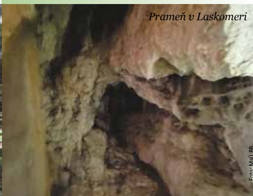
Prameň v Laskomeri