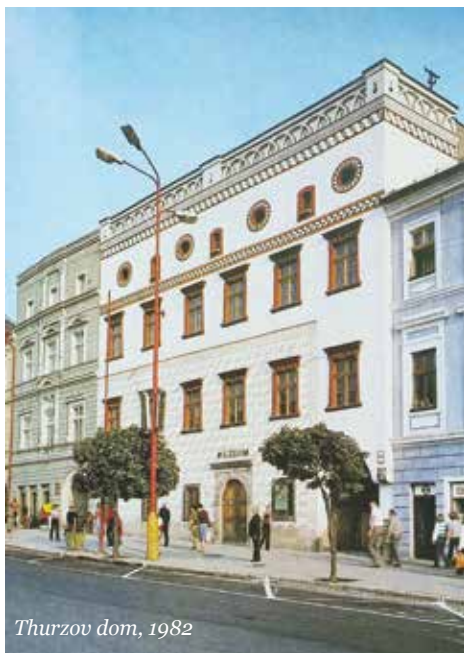
Thurzov dom, 1982

SNP 3, 14, 12 (1960, 1964, 1971), historické jadro mesta (1969), kostolnú baštu (1969), Thurzov dom (1970), objekt na Hornej Striebornej 9 (1979) a meštiansky dom na Nám. SNP 18. Nasledovali výskumy a reštaurovanie deviatich meštianskych domov v mestskej pamiatkovej rezervácii mesta Banská Bystrica a dvanástich pamiatkových architekúr v Kremnici, Levoči a v ďalších slovenských mestách. Zoznam reštaurovaných pamiatok a objektov je mimoriadne bohatý. Patria medzi ne napr. nástenné stredoveké maľby v kostole sv. Mikuláša v Sazdiciach, nástenné maľby kráľov v arkáde renesančného zámku v Haliči, stredoveké fresky v románskej rotunde v Križovanoch nad Dudváhom, vzácne fresky zo 14. storočia v kostolíkoch v neďalekom Čeríne, Dolnej Mičinej, Ponikách, v Zolnej, drevené gotické plastiky a reliéfy v rímskokatolíckom kostole v Krupine, súbor olejomalieb na zámku Zvolen a mnohé ďalšie práce. Posledným Úradníčkovým veľkým dielom bolo v roku 2008 odkrytie ranogotických fresiek zobrazujúcich v dvoch vodorovných pásoch christologický cyklus v presbytériu kostola Narodenia Panny Márie v Nitre – Horných Krškanoch. Horný pás znázorňuje poslednú večeru, dolný pás kľačiaceho mnícha a Kláštor svätého Hyppolita na nitrianskom vrchu Zobor.