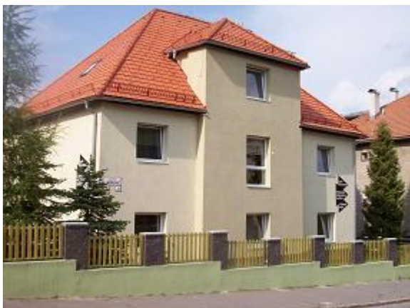
Budova prevádzky Na Uhlisku 1