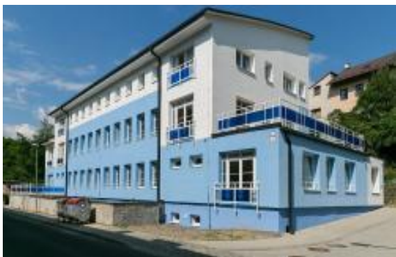
Budova prevádzky na Robotníckej ulici 12