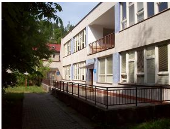
Budova prevádzky na Ul. 9. mája 74