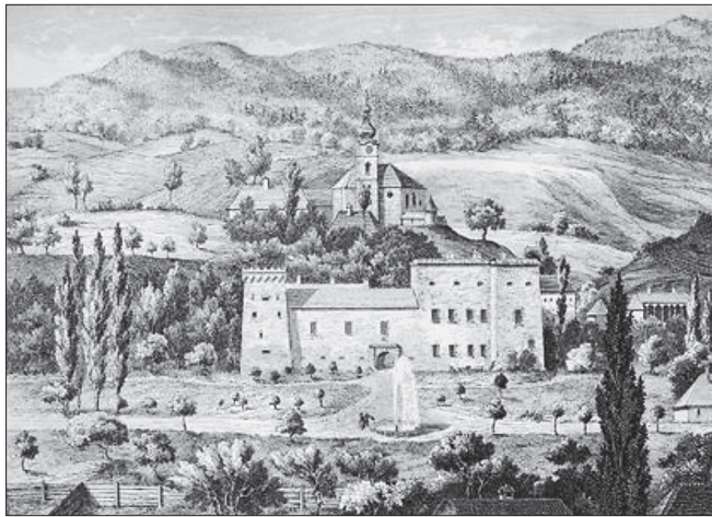
Radvanský kaštieľ na dobovej rytine

k čomu slúžili. Zrejme o železiarsku produkciu sa nejednalo. Vnútro pecí bolo bez akejkoľvek trosky. Na hrnciarske pece sú zistené objekty malé. Ich počet (4) na pomerne malom priestore však nasvedčuje na väčšiu výrobnú aktivitu. Samotné obytné a ďalšie hospodárske stavby sa zrejme nachádzali západne od kaštieľa. Túto skutočnosť by mohli dokladať menšie sídliskové jamy datované laténskou keramikou. Ak uvážime, že v danom priestore údolia Hrona je prevažne severo - južné prúdenie vzduchu je to aj logické. Dym z pecí takto len minimálne zasahoval do života tunajšej komunity. Je teda možné, že niekedy v priebehu 3. a 2. stor. pred Kr. sa v polohe Radvanského kaštieľa nachádzal laténsky dvorec.