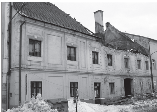
Lazovná 13, január 2006