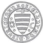
Rekonštrukcia najstaršieho erbu Banskej Bystrice

V histórii Banskej Bystrice postihlo mesto a jeho obyvateľov mnoho pohrôm, ktoré vystriedali relatívne pokojné obdobia. Boli to nielen pohromy spôsobené živlami, ale aj rôznymi povstaniami, vojnami a politickými zmenami.