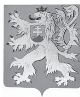
ČSR od r. 1920