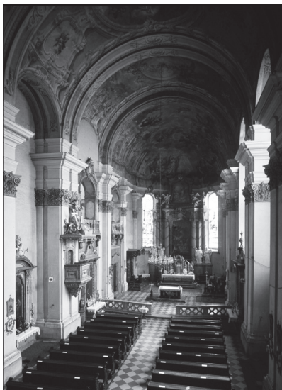
Interiér farského kostola v Banskej Bystrici