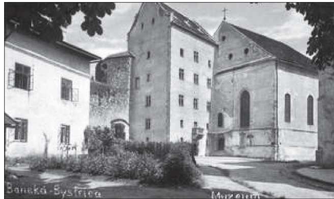
Hradný areál s Matejovým domom - Mestským múzeom