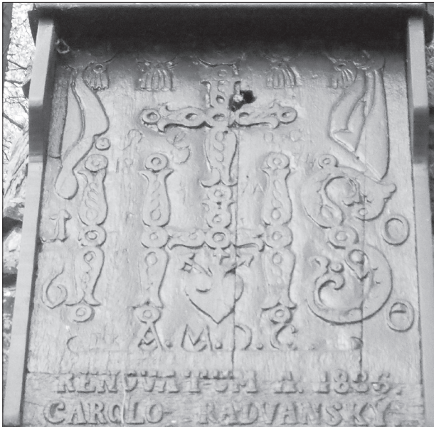
Detail tabule na skale v Malachovskej doline

Text nachádzajúci sa na samotnej drevenej tabuľe je: 16 IHS OO, pod nimi sú písmená A.M.D.C. Ďalej RENOVATUM A.1886 a úplne dolu meno CAROLO RADVANSKÝ.