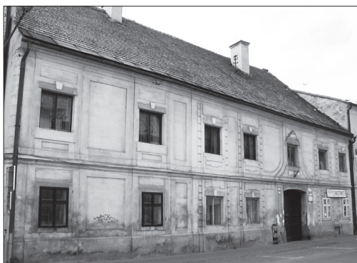
Lazovná 13, máj 2003