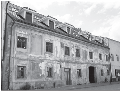
Lazovná 13, máj 2015