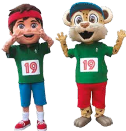
Takto vyzerali maskoti z EYOF 2019 v Baku

EYOF je najväčšie európske multišportové podujatie pre mladých športovcov vo veku od 14 do 18 rokov. Športovci v letných i zimných športoch sa stretávajú v dvojročných cykloch v nepárnych rokoch. EYOF sa koná pod záštitou Medzinárodného olympijského výboru, o jeho organizátorovi rozhodujú Európske olympijské výbory. Už takmer pol roka pracujú správna rada i organizačný výbor na prípravách podujatia. Usporiadatelia v iných mestách majú na prípravu päť rokov, v Banskej Bystrici sa musí všetko zvládnuť v zrýchlenom tempe za necelé dva roky. V roku 2016 získali právo organizovať EYOF 2021 Košice, po troch rokoch však zo snáh upustili a v júli