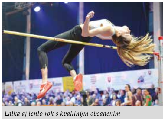
Latka aj tento rok s kvalitným obsadením

Už čoskoro nás čaká v poradí 26. ročník Banskobystrickej latky (BBL). Uskutoční sa 11. februára a opäť má ambíciu ponúknuť to najlepšie, čo má svetová i slovenská výška k dispozícii. Štart potvrdila najväčšia mladá hviezda, len 18-ročná Jaroslava Mahučichová z Ukrajiny, ktorá na MS v Doha získala striebro a dvakrát posunula hodnotu juniorského svetového rekordu na 202 a 204 cm. Premiéru na „latke“ už má za sebou, v roku 2019 skončila tretia. Mladá Ukrajinka je v aktuálnom rebríčku svetovou trojkou. V hale má zatiaľ na konte 199 cm, čo je vyrovnanie halového svetového juniorského rekordu a keďže aj v roku 2020 ešte bude patriť medzi juniorky, môžu sa Štiavničky