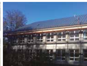
MŠ Ul. 9. mája