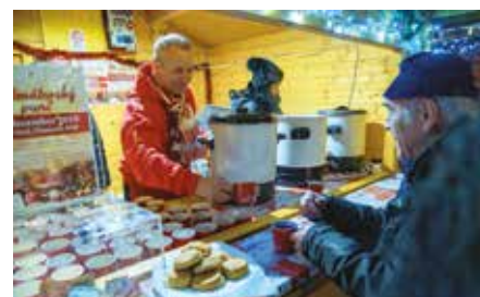
Vyzbierané peniaze opäť pomôžu dobrej veci