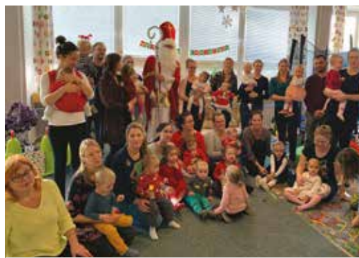
Príchod Mikuláša všetkých potešil

V decembri rozdávalo občianske združenie Materské centrum Mamina lásku, darčeky a úsmevy deťom, a zároveň najstarším obyvateľom Banskej Bystrice. Pre tých najmenších tradične zavítal do centra Mikuláš s bohatou nádielkou dobrôt a skvelej nálady. Mikuláš spolu s deťmi pri koledách rozsvietili vianočný stromček a rozbalili darčeky. Ku koncu roka, v predvianočnom čase, sa centrum zapojilo do projektov „Vianočná pošta“ a „Koľko lásky sa zmestí do krabice od topánok?“ s cieľom spríjemniť toto obdobie seniorom v domovoch dôchodcov a do-