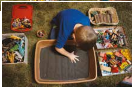
Programy podporujú dobré vzťahy v rodinách

rodín s deťmi, ale aj odborných činností ako sú sociálno-psychologická príprava na adopcie, pestúnstvo, sprostredkovanie kontaktu medzi dieťaťom, ktoré potrebujú náhradnú rodinu a ľuďmi, ktorí splnili kritériá zo zákona... Veľká časť služieb sa zameriava na dlhodobú podporu pre rodiny v rizikových sociálnych situáciách. V súčasnosti Návrat podporuje