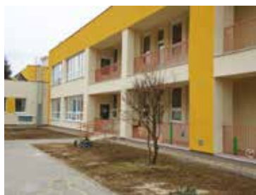
MŠ Na Lúčkach

Oddelenie investičnej výstavby a riadenia projektov, MsÚ BB