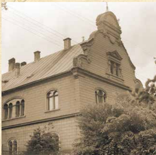
Tihányiovský kaštieľ v roku 1972