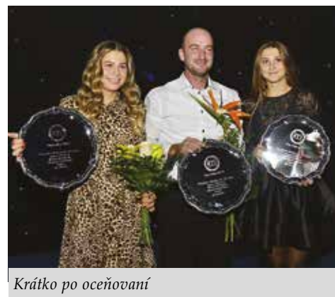
Krátko po oceňovaní