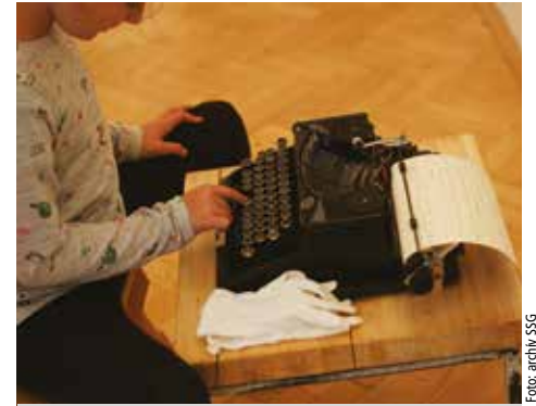
Čakajú Vás mnohé aktivity