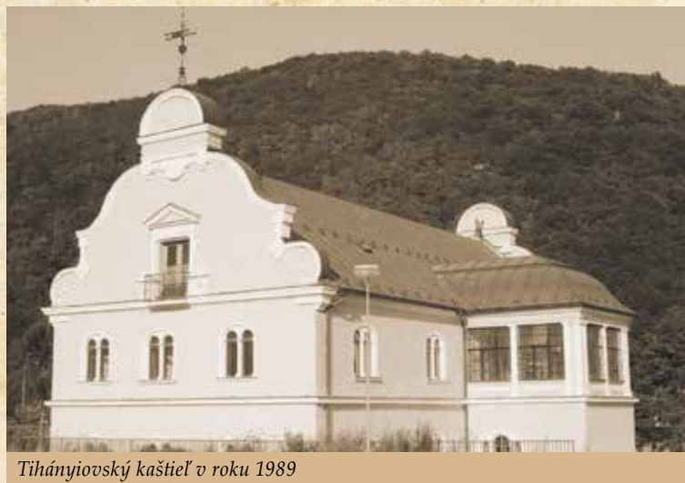
Tihányiovský kaštieľ v roku 1989