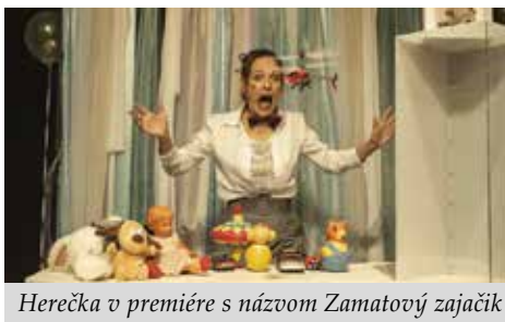
Herečka v premiére s názvom Zamatový zajačik