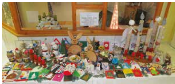
Priestory školy ožili vianočnou výzdobou

Vianoce už tradične patria k najkrajším sviatkom roka a aj školy zdobia svoje priestory tematikou blížiacich sa sviatkov. Žiakom Odborného učilišťa internátneho Viliama Gaňu na Moskovskej ulici sa podarilo urobiť výstavu svojich prác i výrobkov a atmosféru spríjemňuje aj vianočná hudba namiesto zvonenia. Odborné učilište patrí na území mesta do siete škôl, ktoré významným spôsobom pomáhajú pri vzdelávaní a začleňovaní žiakov so špeciálnymi výchovno-vzdelávacími potrebami do spoločenského a pracovného života. Táto škola nesie čestný názov nestora špeciálnej pedagogiky