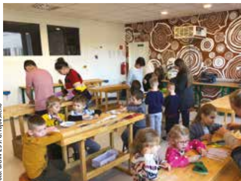
Hravé dopoludnie predškolákov