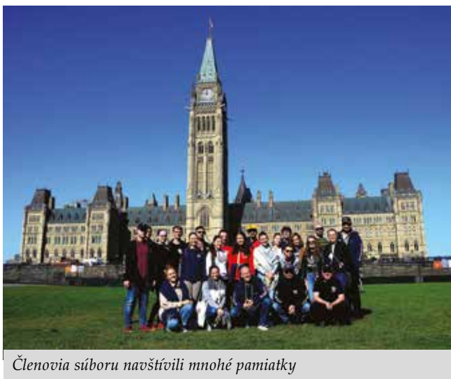
Členovia súboru navštívili mnohé pamiatky

V Bratislave sme sa stretli s celým štábom, ktorý nás mal sprevádzať na tejto ceste. Odlet sme mali z Viedne do Amsterdamu, a odtiaľ do New Yorku. Všetci sme sa tešili na vytúženú Ameriku, krajinu neobmedzených možností. Vo večerných hodinách sme prišli do hotela na Manhattane a vedeli sme, že zajtra nás čaká náročný deň. Naše prvé kroky smerovali do centra na Times Square. Obrovské budovy, vysvietené obrazovky, plno obchodov, všade žlté taxíky. Spomenieme i prvé vystúpenie v rámci tohto projektu pre Slovákov žijúcich v Spojených štátoch amerických, ktoré dopadlo nad naše očakávania. Atmosféra bola skvelá a pocit hrdosti, ktorý pocítite pri stretnutí sa s krajanmi, je nezabudnuteľný. Pittsburgh bol menší a kludnejší ako New York. Pri prechádzke po meste sme mali pocit, akoby sme boli doma. Aj tu sme absolvovali prehliadku mesta a prvá zastávka bola pri pamätnej tabuli Pittsburskej dohody z roku 1918, ktorá schvaľovala spojenie Čechov a Slovákov v novovznikajúcom štáte. Ďalej sme boli v múzeu Andyho Warhola, umelca so sloven-