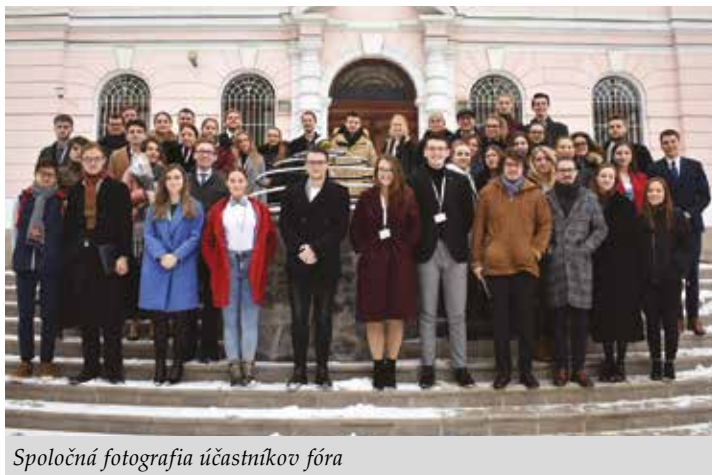
Spoločná fotografia účastníkov fóra

Začiatkom decembra sa v našom meste stretli mladí akademici a odborníci z krajín V4 na Vyšehradskom mládežníckom fóre 2019. V spolupráci s partnerskými organizáciami Euroatlantického centra sa, tak ako minulý rok, uskutočnili v hlavných mestách krajín V4 sprievodené podujatia. Aj nad