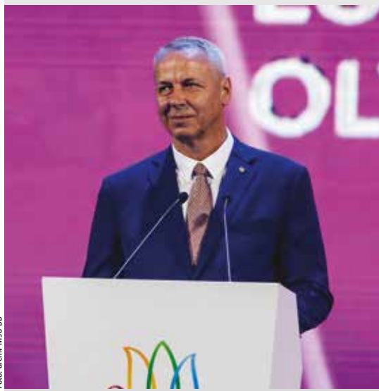
Primátor mesta na záverečnom ceremoniáli EYOF 2019 v azerbajdžanskom Baku