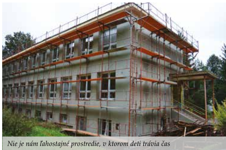
Nie je nám ľahostajné prostredie, v ktorom deti trávia čas

Mesto pripravuje a plánuje podávať projekty v oblasti regenerácie verejných zelených plôch. Ide o projekty – revitalizácia mestského parku či regenerácia vnútroblokov na dvoch sídliskách. V rámci vodozádržných opatrení máme ambíciu zrekonštruovať fontány v Národnej ulici, na ulici Martina Rázusa a pred Hungáriou. Zámerom je aj revitalizácia priestoru Kyjevského námestia, vybudovanie oddychovo-rela-