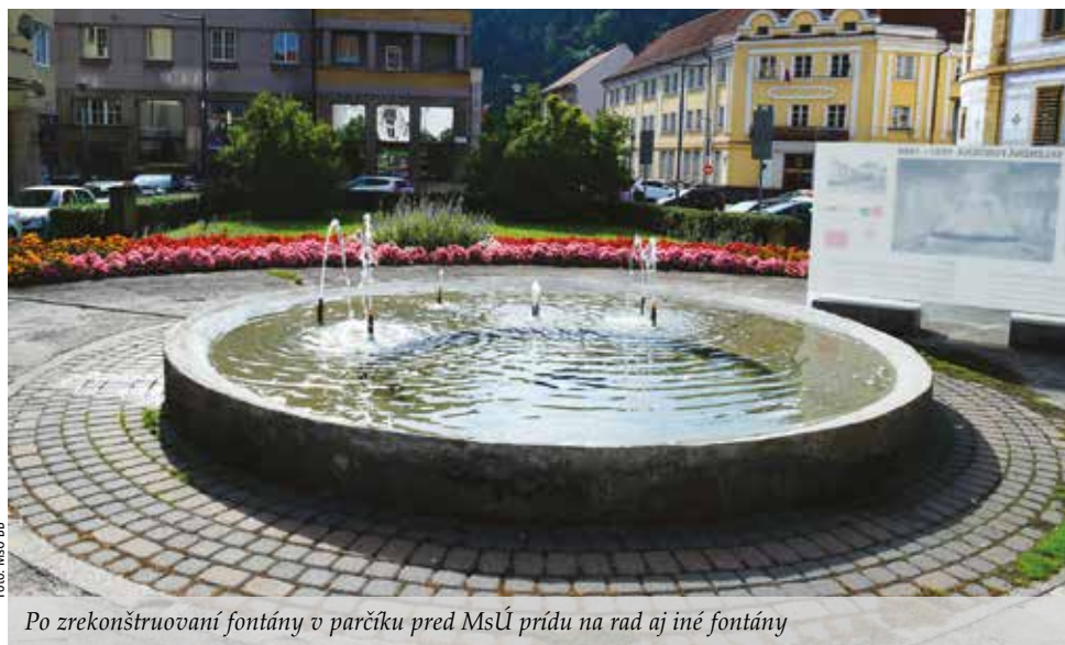
Po zrekonštruovaní fontány v parčíku pred MsÚ prídu na rad aj iné fontány