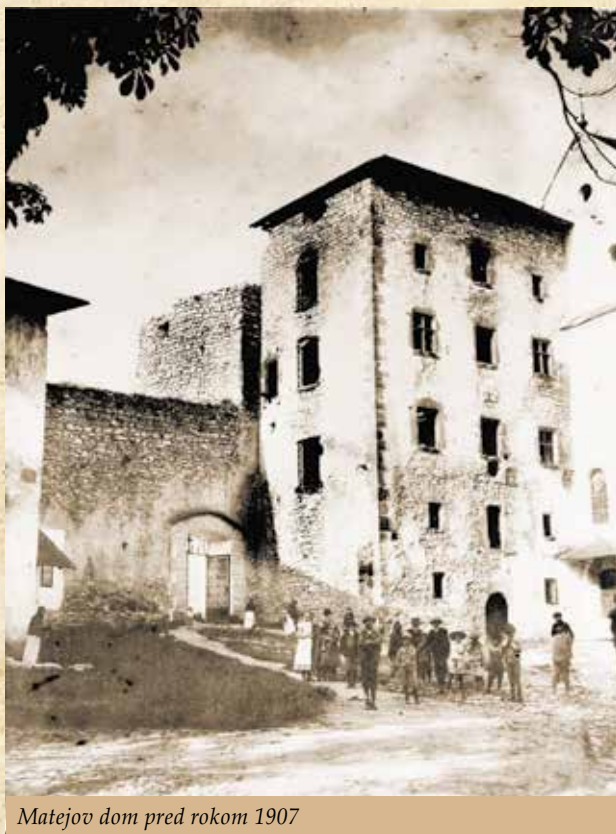
Matejov dom pred rokom 1907