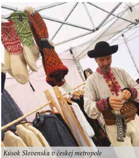
Kúsok Slovenska v českej metropole