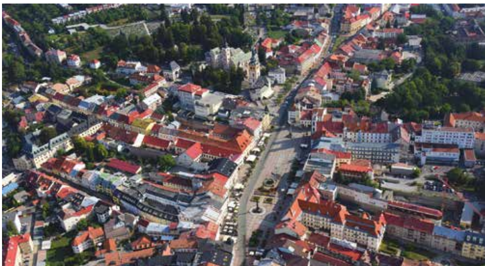
Priority predstavujú cestu k rozvoju mesta a zvýšeniu kvality života obyvateľov

V oblasti dopravy budeme pokračovať v súvislých rekonštrukciách ciest a chodníkov, ktoré sú v nevyhovujúcom stave. Opravy by sa mala dočkať časť cesty a chodníky v úseku od Kyjevského námestia cez Nové Kalište, THK až po kruhový objazd Tajovského. Novú podobu by mala dostať aj cesta a chodníky v Lazovnej ulici od areálu Slovenky po Medený Hámor, vrátane prestavby križovatky. Na rad by sa mali dostať aj ulice Bakossova, Horná od Námestia Š. Moyses a po križovatku pri Hungárii a Hutná od križovatky na Švermovej po štadión Štiavničky. Počíta sa aj s obnovou Partizánskej cesty od budovy ústredia pošty po Prior. Mesto plánuje opravy na Javorníckej, Kollárovej, Gaštanovej či Bernolákovej ulici. V súvislosti s dobudovaním miestnych komunikácií sú medzi prioritami výstavba cesty na ulici Na Troskách, výstavba chodníka v Kremničke ku krematóriu a chodníka