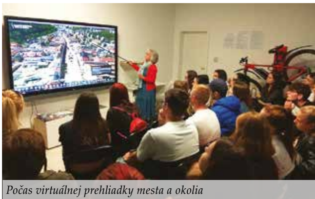
Počas virtuálnej prehliadky mesta a okolia

Novinkou bola virtuálna prehliadka „Banská Bystrica a jej okolie ako ste ich ešte nevideli“ v priestoroch Inovatívneho návštevníckeho centra, ktoré je súčasťou Turistického informačného centra na autobusovej stanici. „Návštevníci videli so zaujímavým výkladom sprievodkyne, prostredníctvom virtuálnej prehliadky, mesto i jeho okolie z neobyčajných pohľadov. Stretli sme sa s veľkým