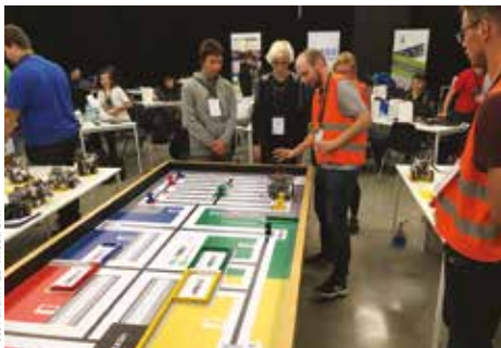
Majstrovstvá sveta sa uskutočnia v Maďarsku

Dňa 24. septembra sa v Košiciach konali prvé majstrovstvá Slovenska v robotike známe pod skratkou WRO™ (World Robot Olympiad™). Súťažilo sa v kategórii Regular – vo vekových skupinách Elementary (do 12 rokov), Junior (od 13 do 15 rokov) a Senior (od 16 do 19 rokov). V skupine Elementary súťažil zmiešaný tím vytvorený zo žiakov ZŠ Trieda SNP a ZŠ Radvanská. V dramatickom a neľahkom súboji nakoniec tento tím zvíťazil a obsadil prvé miesto. Skupina však nebola dostatočne obsadená, pre-