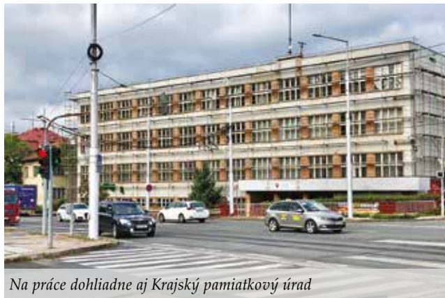
Na práce dohliadne aj Krajský pamiatkový úrad

Základná umelecká škola Jána Cikkera je zapísaná v Ústrednom zozname pamiatkového fondu ako národná kultúrna pamiatka, a preto budú práce prebiehať pod dohľadom Krajského pamiatkového úradu Banská Bystrica. „Pri národných kultúrnych pamiatkach je vždy proces zložitejší. Ide o určitý zásah, a preto je potrebná dôkladná komunikácia s kompetentnými inštitúciami. Základná umelecká škola Jána Cikkera vychováva mladých umelcov v rôznych oblastiach a za prácou pedagógov i žiakov ostávajú viditeľné výsledky v podobe ocenení. Som preto veľmi rád, že sa nám podarilo vysúťažiť zhotoviteľa a vďaka výmene okien a oprave fasády sa po rokoch zvýši komfort výučby. Verím, že obnova bude prebiehať bez problémov.“