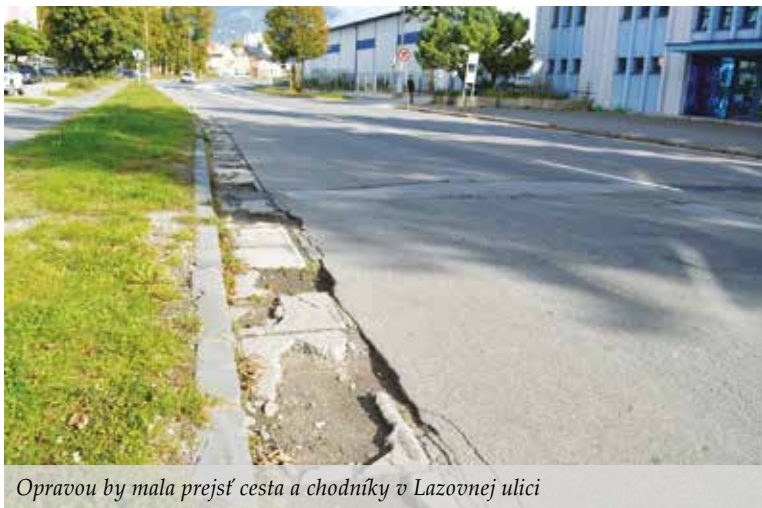
Opravou by mala prejsť cesta a chodníky v Lazovnej ulici

Mesto sa bude snažiť aj o vybudovanie dopravného ihriska, kde by deti mali možnosť získať praktické skúsenosti v oblasti dopravnej výchovy. V Banskej Bystrici sa tak vytvorí priestor, kde sa najmenší budú môcť pripraviť na samostatný pohyb v cestnej premávke ako chodci, cyklisti a zároveň sa postupne vzdelávať ako budúci vodiči motorových vozidiel. Viaceré projekty v budúcnosti budú smerovať k zlepšeniu podmienok pre cyklistov v meste. Dobrým štartom bolo tohtoročné otvorenie prvého cyklostanoviska, požičovne elektrobicyklov či cyklotrasy v meste. K sieti cestičiek pre bezpečný pohyb cyklistov po vzore vyspelých európskych miest by mali prispieť aj výstavby cyklotrás Hušták – Radvaň – Kráľová, Hušták – Ná-