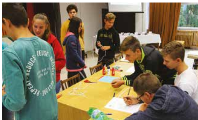
Súťažilo sa v štyroch odborných kategóriách