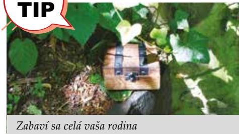
Zabaví sa celá vaša rodina