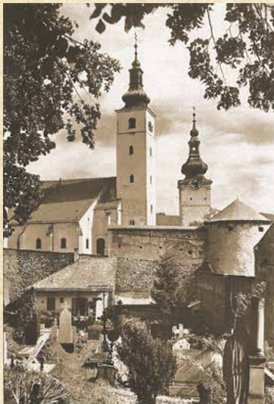
Hradný areál mesta z cintorína

uložením do zeme. Zaniknutý rybník využili ženy ešte začiatkom 20. storočia na močenie ľanu a konope.