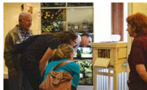
Živý pozorovací úl všetkých zaujal

Pozorovací úl v Tihányiovskom kaštieľi je prvým živým úlom na Slovensku, ktorý je umiestnený priamo v expozícii múzea. Bezpečne, cez pozorovacie okienka môžu návštevníci obdivovať život a prácu včiel, pohľadať kráľovnú, trúda, robotnice a sledovať ich pri bežných činnostiach. „Stredoslovenské múzeum v ničom nezaostáva za mnohými svetovými iniciatívami, ktoré podporujú záchranu včelstva. Po vzore Prírodovedného múzea vo Viedni je prvým múzeom na Slovensku so živým