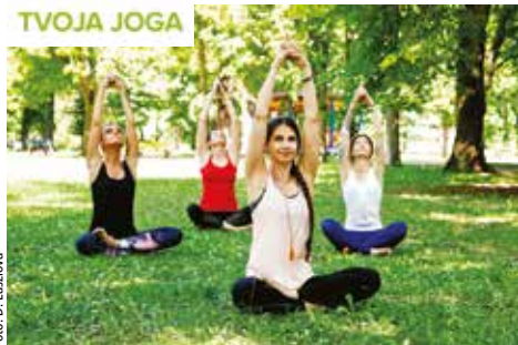
Zapojiť sa môže každý

pružnosť tela, bdelosť mysle a koncentráciu. Cieľom je precítiť ich tak, aby sme boli vnímaťejší k sebe a k svojmu okoliu. Cvičenia nás takisto majú naučiť prekonať únavu, stres alebo napätie. Joga v parku je naozaj pre každého. Nie je to súťaž, preto sa môžu pridať i ľudia bez skúseností. Vzhľadom na skupinový charakter cvičenia odporúčame každému prihladiť na svoj zdravotný stav. Cvičenie jogy je súčasťou zdravého životného štýlu, ale i nástrojom na zmiernenie bolesti. V prípade ochorení a liečby vážnejších kardiovaskulárnych ochorení či ortopedických problémov je vhodné najskôr konzultovať svoj zdravotný stav s lekárom a poradiť sa o vhodnosti cvičenia. Viac sa dozviete na e-mailovej adrese: info@tvojojoga.sk .