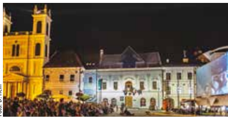
Večerné premietanie filmov má svoje čaro

Bažant Kinematograf je originálny kočovný typ „open-air kina“, ktorý putuje celým Slovenskom. Projekciu filmov zabezpečuje na to prispôsobený retro autobus. Počas prázdninových mesiacov sa zastaví vo viac ako tridsiatich rôznych miestach a jeho predstavenia navštívi tradične okolo 50 000 divákov. Program tvorí kolekcia piatich celovečerných slovenských a českých filmov, ktoré sa premietajú po zotmení o 21:30 hod. V Banskej Bystrici začíname 19. júla trilerom Dôverný nepriateľ s G. Marcinkovou a V. Dykom v hlavných úlohách. O deň neskôr sa môžete tešiť na úspešný český film Teroristka s fantastickou I. Janžurovou v úlohe rozhnevanej učiteľky na dôchodku. Dňa 21. júla je pre Vás pripravený romantický, ironický a baladický príbeh Hastroman . Pôsobivý debut O. Havelku bol ocenený štyrmi soškami Českého leva, vrátane ceny za najlepší mužský herecký výkon v hlavnej úlohe pre K. Dobrého alias baróna de Caus. V pondelok, 22. júla sa zapozerať do kultového dobrodružného cestopisu D. Přibáňa Trabantom tam a zase späť . Tohtoročnú päťicu filmov uzatvoríme 23. júla v komediálnom duchu, tento raz na tému mužsko-ženských a kamarátskych vzťahov. Českému divákemu hitu Ženy v behu kraľuje vynikajúca herečka Z. Adamovská.