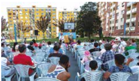
Pred nami sú ešte tri predstavenia

V Banskej Bystrici už piaty rok k letu neodmysliteľne patria aj Sídľiskové večerníčky. Na zaujímavé predstavenia sa tešia nielen deti, ale aj rodičia, ktorí ich sprevádzajú. Prázdniny už odštartovali a spolu s nimi i prvé tohtoročné predstavenia. Rozprávkové podujatie má svoju tradíciu a veľkej pozornosti detí rôznych vekových kategórií sa teší aj tento rok.