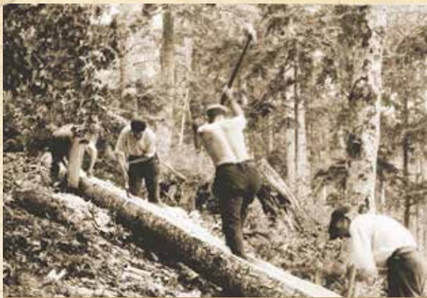
Dlabanie dreveného vodného žlabu pri prameni v Sásovej