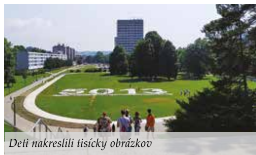
Deti nakreslili tisícky obrázkov