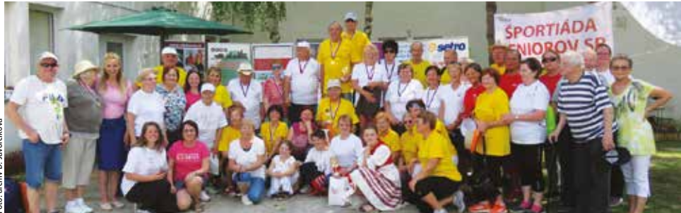
Seniori súťažili v rôznych disciplínach