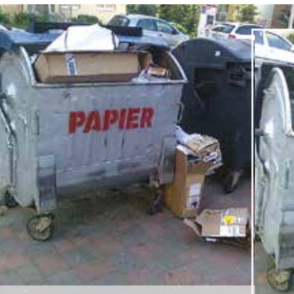
Pred a po minimalizácii papiera