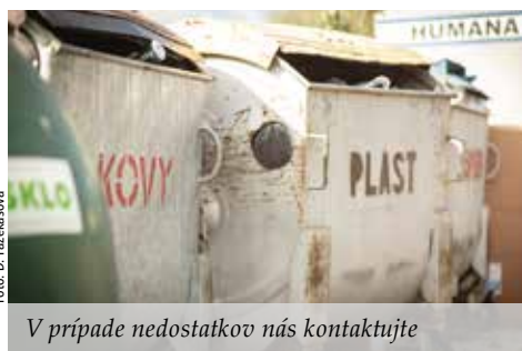
V prípade nedostatkov nás kontaktujte

Harmonogramy zberu komunálneho odpadu a drobného stavebného odpadu, Program odpadového hospodárstva mesta Banská Bystrica na roky 2016 – 2020, ako aj VZN Mesta Banská Bystrica, informácie o triedenom zbere, zbernom dvore, nebezpečnom odpade, elektroodpade, biologicky rozložiteľnom odpade a iné dôležité i užitočné oznamy sú zverejnené na webovej stránke mesta v sek-