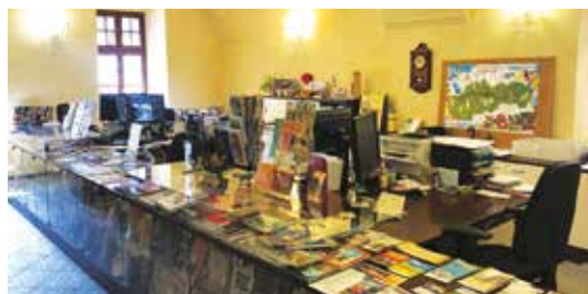
Priestory Informačného centra v radnici

Určite ste naše Informačné centrum niekedy navštívili a využili jeho služby. Teraz ho môžete podporiť aj v ankete o najobľúbenejšie Informačné centrum 2019. Hlasovať je možné od 21. júna do 31. augusta 2019 na webových portáloch www.kamposlovensku.sk a www.aices.sk . Po ukončení ankety budú vyžrebovaní hlasujúci odmenení atraktívnymi cenami. Cieľom