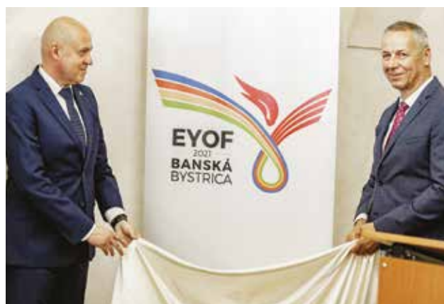
Logo má vizuálne nadviazať na logo Európskeho mesta športu