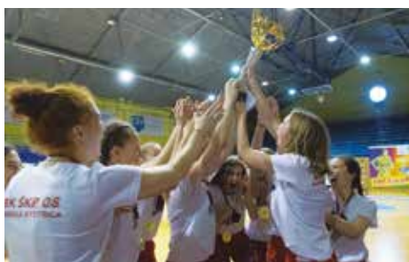
Radosť z titulu bola veľká

V dňoch 31. mája – 2. júna 2019 sa mladé basketbalistky z Banskej Bystrice zúčastnili na finálovom turnaji o majstra SR v kategórii kadetiek. Turnaj s názvom Final four sa hral v košíckej Infinity aréne a zúčastnili sa ho štyri najlepšie družstvá dlhodobej časti súťaže – Košice U17, Košice U16, Zvolen a naše družstvo. Hralo sa systémom každý s každým. Prvý zápas dievčatá síce prehrali so Zvolenom, no po víťazstvách nad oboma košíckymi výbermi