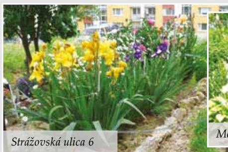
Strážovská ulica 6