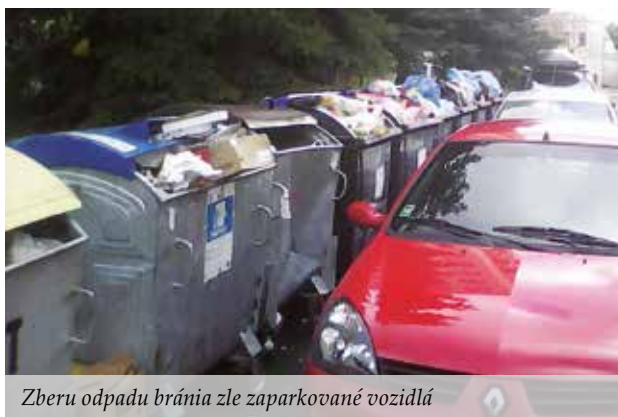
Zberu odpadu bránia zle zaparkované vozidlá

Aby nanovo nastavené podmienky boli účinné, musia byť nápomocní i občania. Opakovane problematické je vykladanie nadrozmerného odpadu mimo stanoveného termínu a umiestňovanie akéhokoľvek odpadu mimo nádob na to určených. Dôležité je preto naďalej dodržiavať stanovené harmonogramy zberu komunálneho odpadu. Len takto vieme zabezpečiť trvalú čistotu okolia nádob a verejných priestranstiev, aj na-