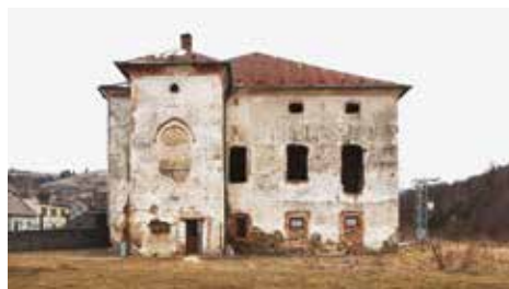
Kaštieľ v obci Holumnica pri Kežmarku