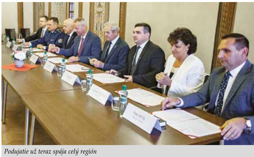
Podujatie už teraz spája celý región