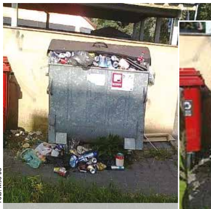
Pred a po minimalizácii kovov

nosti, dedičstva, pozostalosti a pod. V takomto prípade je pri zväčšenom množstve odpadov potrebné využiť Mestskú zberňu odpadov v Radvani – Dechetteries, ktorá je otvorená šesť dní v týždni, od pondelka do soboty. Zberný dvor môže bezodplatne využívať každý obyvateľ mesta na odovzdanie komunálneho odpadu, ako sú papier, plasty, sklo, kovy, drevo, objemný odpad, biologicky rozložiteľný odpad s výnimkou drobného stavebného odpadu (DSO). Za DSO sa hradí 0,02 eura za 1 kg odovzdaného odpadu.