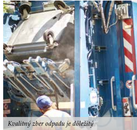
Kvalitný zber odpadu je dôležitý

ru triedeného zberu komunálneho odpadu v roku 2019 na 50 percent a v roku 2020 na 60 percent. Cieľom je do roku 2020 znížiť aj množstvo vzniku zmesového komunálneho odpadu na 17 500 ton. V smernej časti programu informujeme o dostupnosti zariadení na spracovanie jednotlivých druhov komunálneho odpadu. Sme presvedčení, že spoločným úsilím stanovené ciele dosiahneme a posunieme sa o krok ďalej aj v oblasti nakladania s komunálnym odpadom. Od dosiahnutej úrovne triedenia odpadov sa odvíja aj výška poplatku pre mesto za uloženie komunálneho odpadu na skládke.