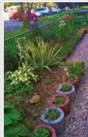
Ulica Družby 2