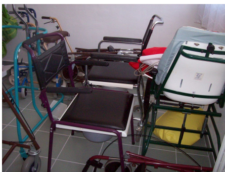
požičiavanie kompenzačných pomôcok