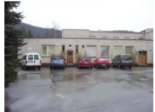
areál objektu ASS s parkoviskom

Rehabilitačnú činnosť v domácnosti je možné poskytovať na základe podania žiadosti o poskytovanie rehabilitačnej činnosti v domácnosti a na základe vyjadrenia odborného rehabilitačného lekára.