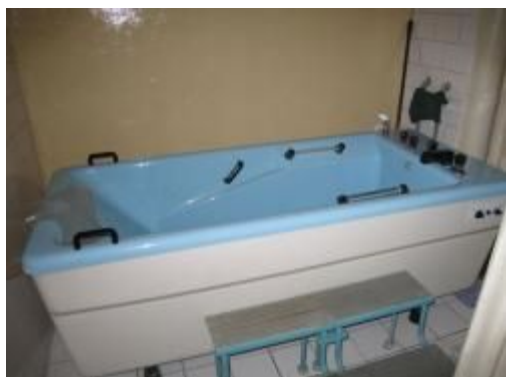
priestory rehabilitácie, Krivánska č.20

Podrobnejšie informácie získate aj na Klientskom centre Mestského úradu, ul. Československej armády 26 v Banskej Bystrici (tel. 048/4330 777, 0800 14 15 14).