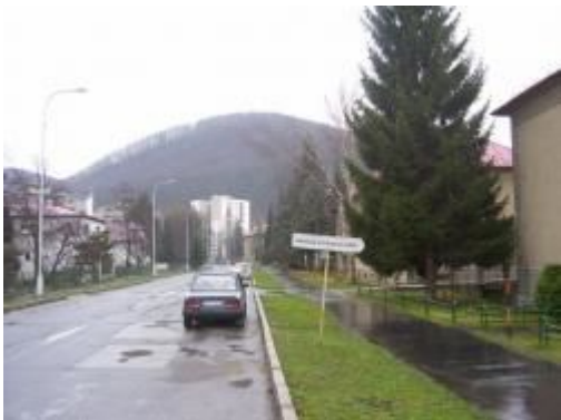
smerová tabuľa k objektu ASS