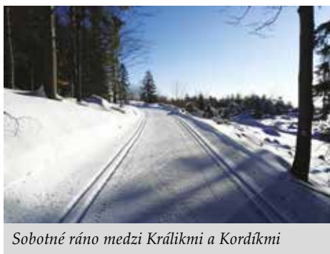
Sobotné ráno medzi Králikmi a Kordíkmi

Po dvojročnej prestávke sa v tejto sezóne opäť upravuje aj tzv. Malachovská zväžnica. V minulosti sa tu pôvodná zväžnica viackrát zosunula. Lesy SR tu vybudovali novú obchádzkovú