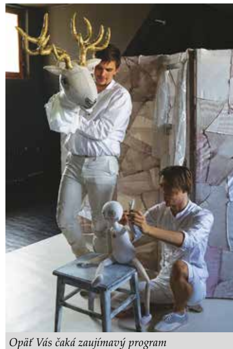
Opäť Vás čaká zaujímavý program