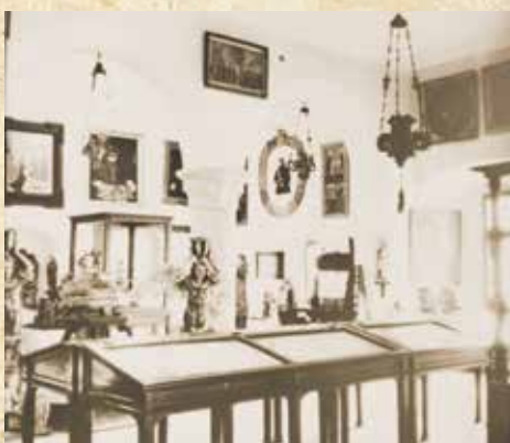
Unikátny záber z pôvodnej expozície Mestského múzea