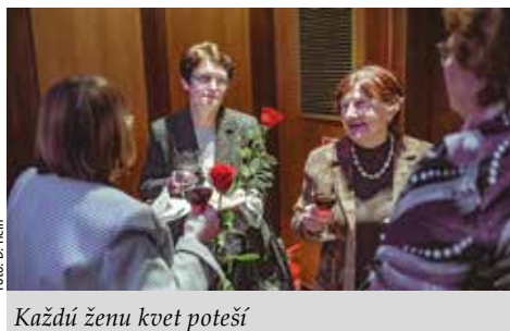
Každú ženu kvet poteší

Dňa 8. marca si každoročne ľudia z celého sveta pripomínajú Medzinárodný deň žien. Vznik tohto sviatku sa viaže na štrajk newyorských robotníčok v marci 1908. Ženy bojovali za zrušenie desaťhodinového pracovného času. Takisto vyjadrovali nespokojnosť s nízkymi mzdami a zlými pracovnými podmienkami. O dva roky neskôr sa v Kodani konala Medzinárodná ženská konferencia, na ktorej vznikol nápad oslavovať medzinárodný deň žien. Následne sa v marci oslavoval tento deň v Rakúsku, Dánsku, Nemecku a Švajčiarsku. Medzinárodný deň žien bol uznaný Organizáciou spojených národov ako medzinárodný sviatok v roku 1975. Na tento výnimočný sviatok nezabúda ani mesto Banská Bystrica a pravidelne si ho pripomína. V piatok, 8. marca ste všetky ženy srdečne vítané v priestoroch Robotníckeho domu, aby ste si spoločne s nami pripomenuli tento významný deň. Tento rok sa k oslave sviatku pridá aj známa banskobystrická skupina Duchoňovci, ktorá interpretuje nestarnúce piesne Karola Duchoňa. Pre každú ženu je pripravený kvet a malé občerstvenie.