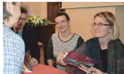
Kniha vyzdvihuje osobnosť Š. Moysesu

Milí naši čitatelia, prinášame Vám súťaž o knihu Štefan Moyzes – za života a v historickej pamäti. Zapojte sa do našej súťaže na strane 14 a jeden z Vás si bude môcť medzi prvými zaradiť túto publikáciu do svojej zbierky. Meno výhercu sa dozviete v marcovom vydaní Radničných novin.