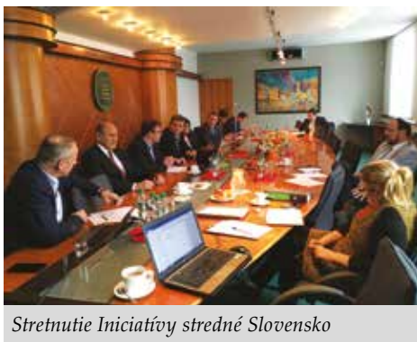
Stretnutie Iniciatívy stredné Slovensko

Obyvateľom stredného Slovenska chýba na trase severojužného a východozápadného prepojenia moderná dopravná infraštruktúra. Iniciatíva vznikla v máji 2017 a svojou činnosťou chce dosiahnuť dobudovanie prepojenia našej krajiny, diaľnice D1 v úseku Turany – Hubová a Hubová – Ivachnová, rýchlostnej cesty R3 Trstená – Dolný Kubín, R1 Ružomberok – Banská Bystrica a súvisiace spojenie I/71 Lučenec – Fiľakovo – Salgótarján. Medzi jej priority patrí aj liberalizácia železničnej dopravy na strednom Slovensku, čo by malo priniesť ďalšie zlepšenie v tejto oblasti. V závere roka 2017 sa uskutočnila programová konferencia, ktorá vo viacerých dotknutých mestách vyústila do blokad ciest. Zároveň z nej vyplynuli konkrétne požiadavky na zlepšenie situácie, ktoré boli smerované kompetentným na najvyššej štátnej úrovni. Nakoľko dohodnuté termíny a harmonogram potrebných úkonov nevyhnutných k realizácii jednotlivých úsekov prepojenia neboli zo strany NDS dodržané, v máji 2018 členovia