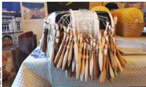
Tradičné remeslá sú súčasťou kultúrneho dedičstva