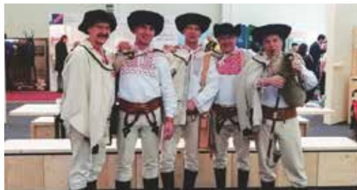
Veľtrh ponúkol bohatý sprievodný program

Veľtrh poskytol návštevníkom komplexný prehľad o dovolenkách nielen na Slovensku, ale aj v obľúbených destináciách na celom svete. Návštevníci mohli porovnať ponuky cestovných kancelárií, najvýznamnejších slovenských kúpeľov a dozvedieť sa informácie o destináciách od zástupcov jednotlivých krajín a regiónov. Na ploche 17 000 m 2 sa predstavilo približne 320 vystavovateľov z osemnástich krajín z celého sveta. Veľtrh počas týchto dní navštívilo viac ako 11 000 ľudí. Banskobystrický kraj návštevníkom ponúkol bohatý sprievodný program (Divadlo Štúdia tanca, Horehornskí chlopi, Bábkové divadlo na rázcestí, Dobrá škola zo Španej doliny, škola kváskovania chleba z Podpoľania a iné). V našom stánku si účastníci mohli pochutnať na lokálnych produktoch ako