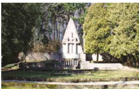
Pamätník obetiam fašizmu v Kremničke