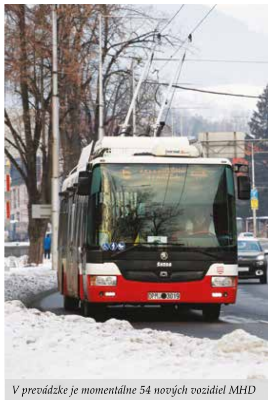
V prevádzke je momentálne 54 nových vozidiel MHD

Vedenie mesta si uvedomuje, že súčasný stav dopravy v meste začína meniť dopravné návyky ľudí, ktorí premávku hodnotia ako problémovú vo vybraných uzloch (OC Point, Belveder, centrum mesta). Preto musí prejsť MHD v meste reorganizáciou. V tomto procese nám pomôže profesionálne poradenstvo z Technickej univerzity vo Viedni.