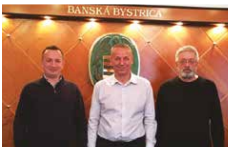
Máme dvoch viceprimátorov