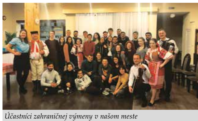
Účastníci zahraničnej výmeny v našom meste

ukázať čo o svojej krajine vedia a čo chcú ukázať ostatným. Túto možnosť ponúka Európska únia, vďaka ktorej môžu mladí cestovať po rôznych krajinách sveta. Cieľom Rady študentov je ukázať bystrickým študentom, že kultúrna rôznorodosť je v našej spoločnosti prirodzená. Ďalšie aktivity, ktoré Rada tento rok plánuje, budú aktivity – podpora volieb do europarlamentu, mimoškolské vzdelávanie Kurz mladého lídra, spolupráca s mestom na tvorbe dokumentov mládežníckej politiky. Okrem toho Rada opäť prijíma nových