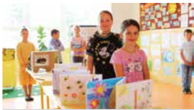
Informácie o včelách nájdete po celej škole