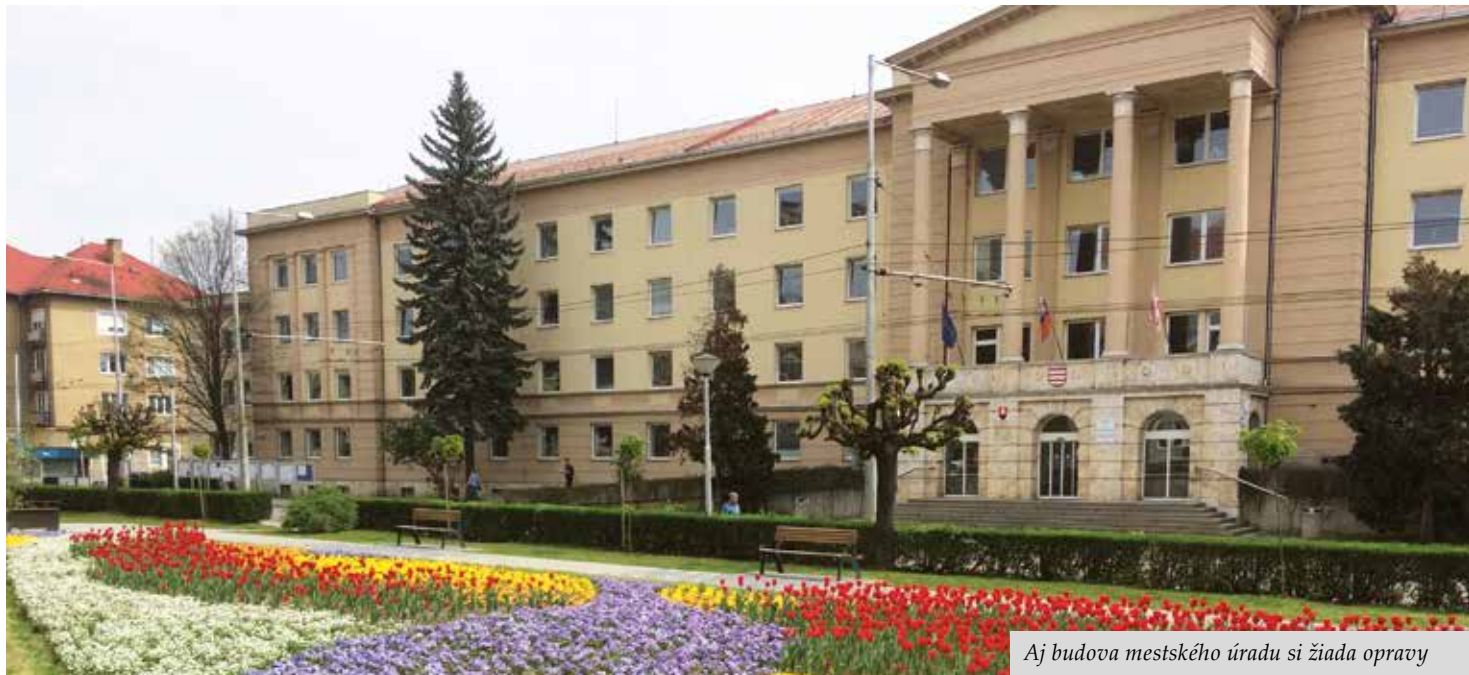
Aj budova mestského úradu si žiada opravy

Aj keď nejde o veľké rekonštrukcie, ale o drobné opravy, ich realizácia je nevyhnutná k zabezpečeniu bezproblémového chodu mestských zariadení. Investície do malých „neviditeľných“ opráv na budovách v majetku mesta sa zameriavajú na stavebnú obnovu objektov, opravy inžinierskych sietí, odstraňovanie havarijných stavov a nákup potrebného vybavenia. V mestskom rozpočte je na tento účel vyčlenených približne 1 000 000 eur.