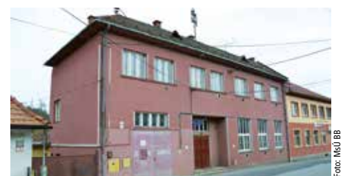
Hasičská zbrojnica v Šalkovej

Mesto Banská Bystrica sa úspešne zapojilo do výzvy Ministerstva vnútra SR na financovanie podpory ochrany pred požiarmi. Financie v hodnote 46 038 eur využijeme na hasičské zbrojnice v Šalkovej a Rakytovciach. Ide o drobné opravy vnútorných priestorov pre parkovanie požiariarnej techniky. Zhotoviteľov oboch zbrojníc má mesto vysúťažených a v súčasnosti čakáme na podpis dotačnej zmluvy, aby sme mohli začať s prácami. dmo