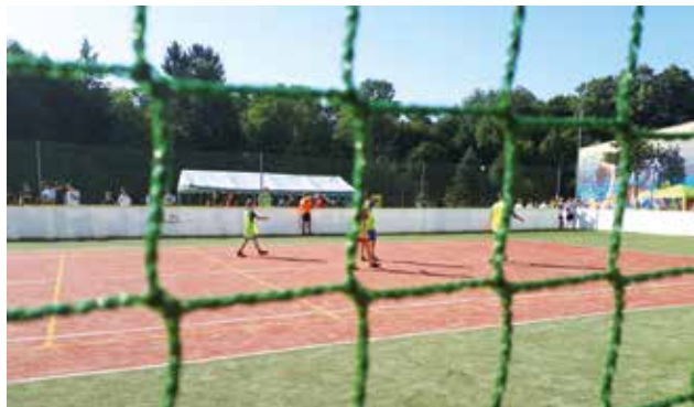
Deti zo školy v Radvani budú mať ďalšie ihriská

ského v Podlaviciach a pri ZŠ Radvanská 1. Na oba areály už mesto vysúťažilo zhotoviteľa a podalo žiadosti na stavebné povolenia. Po ich schválení sa začne s prácami, ktoré sú plánované na začiatok júla. V priebehu septembra by tak mali mať žiaci zo ZŠ J. G. Tajovského k dispozícii obnovené športovisko so spevneným povrchom, ktoré po verejnom obstarávaní bude financované z rozpočtu mesta v hodnote 200 391 eur. ihrisko na Radvanskej 1 bude financované z dotácie vlády Slovenskej republiky vo výške 450 000 eur. K multifunkčnému ihrisku s umelou trávou pribudne atletická dráha, volejbalové a malé futbalové ihrisko.