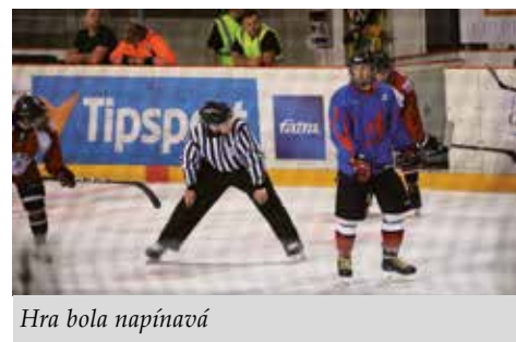
Hra bola napínavá