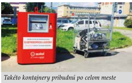
Takéto kontajnery pribudnú po celom meste

Banská Bystrica je druhé krajské mesto, kde sú umiestnené špeciálne červeno-biele kontajnery na triedenie a zber, predovšetkým malých elektrospotrebičov, akými sú napr. fény, mixéry, mobily, ale i batérie a akumulátory. Triedením elektroodpadu a použitých batérií chránime životné prostredie. V meste pod Urpínom pribudne 20 červeno-bielych kontajnerov, ktoré umožnia Banskobystričanom komfortne triediť nepotrebný elektroodpad. Ich výhodou je, že sú dostupné kedykoľvek a nemajú otváracie hodiny ako napr. zberné dvory. ASEKOL SK je neziskovo hospodáriaca organizácia, ktorá od roku 2010 zabezpečuje na Slovensku nakladanie s elektroodpadom, použitými batériami a akumulátormi, a tiež najväčšia organizácia zodpovednosti výrobcov pre prenosné batérie a akumulátory na Slovensku. Unikátna sieť červeno – bielych kontajnerov, ktorú táto organizácia buduje od roku 2016, sa tak rozšírila už do šiesteho mesta. Tento rok môže využívať červeno-biele kontajnery už viac ako 200-tisíc obyvateľov a za rok a pol fungovania prostredníctvom nich bolo vyzbieraných už viac ako 16 t drobného elektra, čo je dobrá správa pre životné prostredie. Zber elektroodpadu a pou-