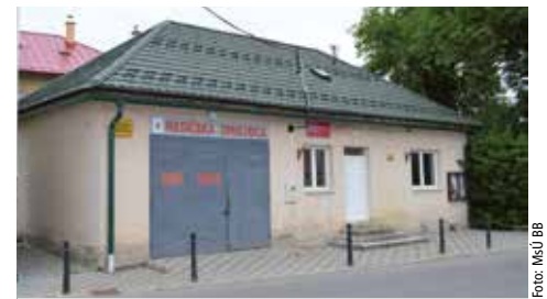
Hasičská zbrojnica v Rakytovciach

Mesto Banská Bystrica sa úspešne zapojilo do výzvy Ministerstva vnútra SR na financovanie podpory ochrany pred požiarmi. Financie v hodnote 46 038 eur využijeme na hasičské zbrojnice v Šalkovej a Rakytovciach. Ide o drobné opravy vnútorných priestorov pre parkovanie požiariarnej techniky. Zhotoviteľov oboch zbrojníc má mesto vysúťažených a v súčasnosti čakáme na podpis dotačnej zmluvy, aby sme mohli začať s prácami. dmo