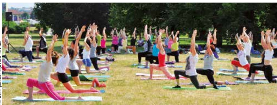
Joga je obľúbená v každom veku a dá sa cvičiť aj v prírode

Spoločnosť Joga v dennom živote pobočka Banská Bystrica