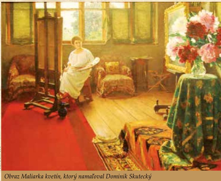
Obraz Maliarka kvetín, ktorý namaľoval Dominik Skutecký