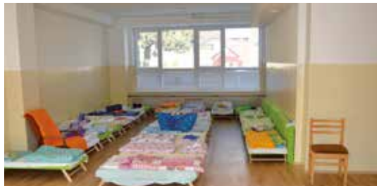
Plastové okná a nové priestory vytvárajú kvalitné podmienky pre najmenších

Staré drevené okná v triedach materských škôl samospráva vymieňala približne pred dvoma rokmi za plastové. Koncom mája 2018 mesto začalo aj s výmenou v hospodárskych častiach budov v materských školách na Šalgotarjanskej, Magurskej, Novej a Radvanskej ulici. Výmena bude mesto stáť 106 634 eur a práce by mali byť hotové do konca augusta.