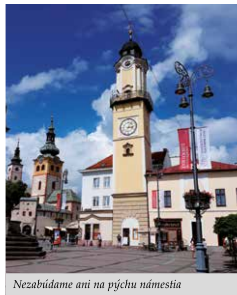
Nezabúdame ani na pýchu námestia