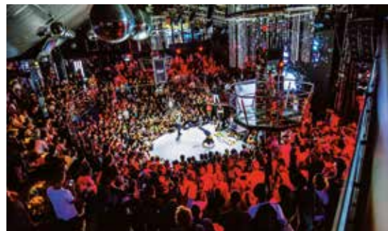
Každý ročník sa teší obrovskému záujmu

Ďalší ročník úspešného festivalu sa uskutoční v meste pod Urpínom už 28. júla 2018. Na vyznávačov hip-hopovej kultúry postupne čakajú tradičné i nové koncepty venované milovníkom bboyingu, ale aj ostatným pouličným tanečným štýlom. Okrem projektov Outbreak Europe a Undisputed, Rep Your Country či HLM Anniversary si totiž po prvý raz môžu tanečníci zmerať svoje sily v Streetdance Battle. Divácky atraktívnym konceptom bude určite aj The Legits Blast Concert, ktorého headlinerom je tento rok americká legenda DAS EFX. Projekty sa po ôsmich rokoch uskutočnia na novej adrese. Usporiadatelia festivalu sa rozhodli po prvý raz preniesť hlavné dianie festivalu do väčšieho priestoru – na bystrické kúpalisko Aqualand. „Festival The Legits Blast každým rokom rastie, čomu sa tešíme. Na akcii sa z roka na rok zúčastňuje stále viac a viac tanečníkov z vyše 70 krajín celého sveta a chceme, aby sa u nás cíti-