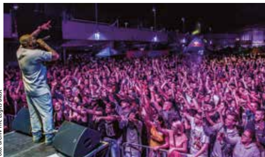
Tento rok sa zaplnia priestory plážového kúpaliska