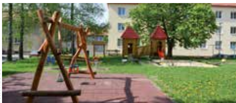
Ihrisko vnútrobloku Wolkerova – Jilemnického

Platná legislatíva upravujúca problematiku detských ihrísk kladie dôraz najmä na bezpečnosť detí. Herné prvky musia byť certifikované. Aktivity spojené s budovaním resp. údržbou detských ihrísk ovplyvňuje viacero faktorov – vlastnícke vzťahy, georeliéf, inžinierske siete, materiál, ale aj výška schválených financií. Na území mesta sme sa do konca roka 2018 zamerali na rekonštrukcie existujúcich ihrísk, ktoré nezodpovedajú legislatíve a na údržbu. Vo vnútrobloku Wolkerova – Jilemnického pribudol herný prvok Kremienok a Chocholúšik,