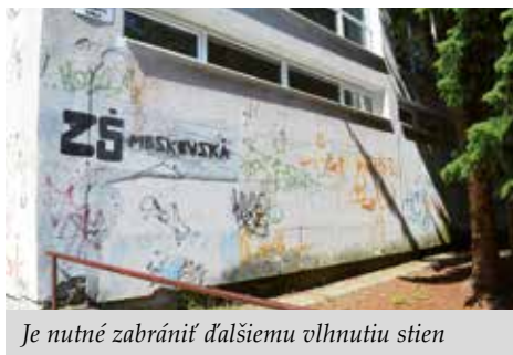
Je nutné zabrániť ďalšiemu vlnutiu stien

Vedenie mesta už dlhodobo investuje do údržby priestorov svojich materských a základných škôl. Nevyhnutné opravy ZŠ (414 000 eur) a MŠ (154 000 eur) sa do dnešného dňa zamerali na odstraňovanie havarijného stavu kanalizácie, výmeny ventilov, kúrenárske práce, opravy komínov, strešných odtokov, výtahov, rozvodov elektroinštalácií, zábradlí či na odstránenie vlnutia stien. Za zmienku stojí, o. i., investícia 60 000 eur na výmenu okien a dverí na bývalej ZŠ Tatranská či oprava nášlapných vrstiev v hodnote cca 70 000 eur v ZŠ Ďumbierska. Okrem toho mesto investovalo 30 000 eur aj do nákupu detských stolov a stoličiek v materských školách. „Významnú investíciu predstavuje aj položka 120 000 eur, ktorú budeme počas leta čerpať na nákup vybavenia kuchýň v základných a materských školách. Veľa spotrebičov už nespĺňa požiadavky dnešnej