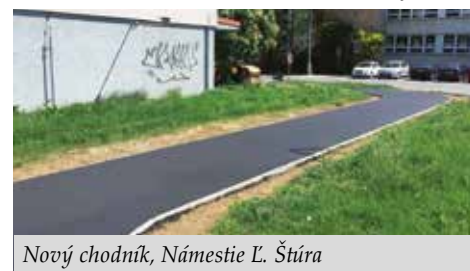
Nový chodník, Námestie L. Štúra

Oddelenie údržby miestnych komunikácií a inžinierskych sietí