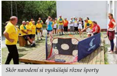
Skôr narodení si vyskúšajú rôzne športy