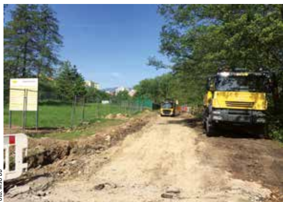
Úsek budúcej cyklotrasy

Banská Bystrica by sa už čoskoro mohla pochváliť prvou reálnou cyklotrasou. Po dlhých procesoch majetkovo-právneho vysporiadania, výkupu pozemkov, prípravy projektu, územného a stavebného konania i verejného obstarávania, začalo mesto s jej výstavbou už v polovici apríla. Na realizáciu novej, takmer dvojkilometrovej cyklotrasy, získala samospráva nenávratný finančný príspevok z Integrovaného regionálneho operačného programu vo výške 857 870 eur. Finančná spoluúčasť mesta (päť percent) predstavuje sumu 45 151 eur. Mesto v minulom období výstavbe cyklotrás nevenovalo veľkú pozornosť, o čom svedčí jediný 150-metrový úsek cyklistického chodníka od nákupného centra ESC po Štadión SNP. Reštart nastal v roku 2016, keď vedenie mesta vyčlenilo rekordnú sumu finančných prostriedkov 360 000 eur na prípravu projektovej dokumentácie a výkupu pozemkov. Cyklotrasa bude viesť z Podlavíc na Hušták. Po napojení na už existujúci cyklochodník bude mať dĺžku približne 2,5 kilometra. Prísľub od zhotoviteľa je ukončiť celé dielo do konca roka, aj keď zmluva je