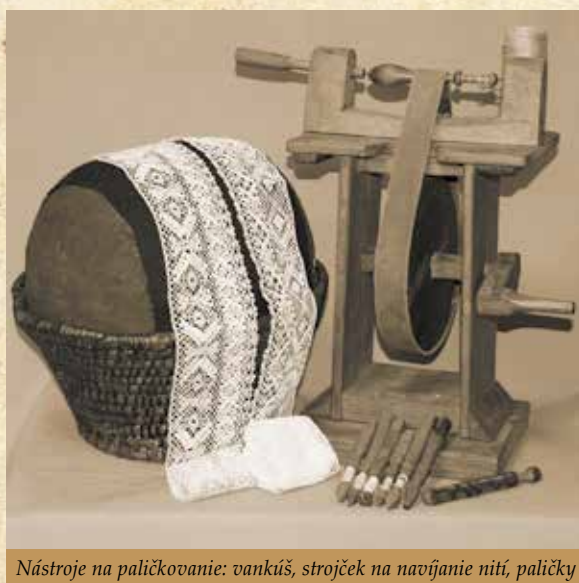
Nástroje na paličkovanie: vankúš, strojček na navíjanie nití, paličky

V prameňoch sa výraz čipka na Slovensku po prvý raz uvádza v roku 1579. Boli to najmä čipky talianske a španielske, kúpené spravidla vo Viedni. Najstaršími a najväčšími strediskami čipkárskej výroby boli banícke osady okolo Banskej Štiavnice, Banskej Bystrice, Kremnice a Prešova, kde sa už v 17. storočí čipky pletli. Rozšírenie čipkárstva v týchto oblastiach sa dá vysvetliť biednymi sociálnymi pomermi baníckeho obyvateľstva, ktoré žilo výhradne z takejto práce za mzdu, lebo príroda v okolí neposkytovala možnosti pre poľnohospodárstvo. Hospodárska situácia v baníckych obciach v 16. a 17. storočí bola taká biedna, že baníci a ich ženy si museli hľadať vedľajšie zamestnanie, aby mohli uživiť rodinu. Jedným z vedľajších prameňov zárobku bola i výroba a predaj čipiek. V 18. storočí čipky na Slovensku už dosahovali vysokú estetickú i technickú úroveň. Z tohto obdobia sú správy, že ich predávali čipkári – priekupníci z Lupčianskeho panstva i zo Zvolenskej župy na Dolnú zem, do Chorvátska, Slavónie, Sedmohradska.