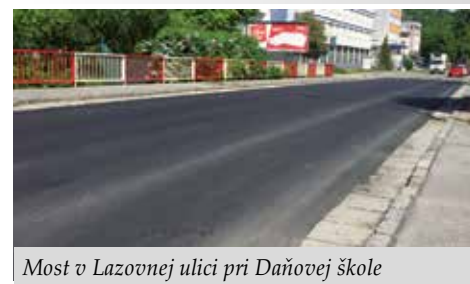
Most v Lazovnej ulici pri Daňovej škole

Mesto Banská Bystrica sa v súčasnosti nezameriava len na rozsiahlejšiu obnovu Zvolenskej cesty a Poľnej ulice, ale aj na menšie opravy ciest a chodníkov či odstraňovanie výtlkov. Nedávno sme dokončili cestu na Hurbanovej ulici pri parku či viaceré úseky na Bottovej a Lazovnej ulici od Daňovej školy až po bývalú budovu Slovenky. Zameriavame sa aj na skvalitňovanie ciest v ostatných mestských častiach. V čase uzávierky Radničných novín sa opravuje chodník na Námestí L. Štúra v Radvani, cesta na Golianovej ulici na Uhlisku, Magurskej ulici v Sásovej a opravy prebiehajú aj na Povstaleckej a Pestovateľskej ulici či na THK. V najbližšom období plánuje mesto začať s opravou chodníka na ulici Terézie Vansovej, Jilemnického ulici a Ulici kpt. Nálepku. Vnútroblokovú komunikáciu plánujeme obnoviť aj na Jilemnického 32 – 46, Ulici kpt. Nálepku 2 – 8 a na Wolkerovej ulici 8 – 18.