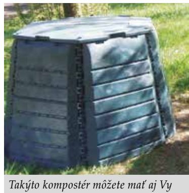
Takýto kompostér môžete mať aj Vy

Biologicky rozložiteľné odpady (BRO) alebo bioodpady tvoria podľa údajov Ministerstva životného prostredia SR až 38 percent objemu komunálneho odpadu. Ich uloženie na skládke sa významne podieľa na tvorbe tzv. skleníkových plynov, a preto je ich skládkovanie v súčasnosti zo zákona zakázané. V roku 2010 sa v Banskej Bystrici zaviedol triedený zber BRO prostredníctvom 240 l nádob v rodinných domoch a 660 l kontajnerov na sídliskách. O obľube tohto zberu u obyvateľov svedčí významný pokles množstva odpadu ukladaného na skládke, a tiež posilňovanie zberu v rodinných domoch. Tento rok majú obyvatelia možnosť vybrať si medzi nádobou a kompostovacím zásobníkom – kompostérom. Kompostovanie na mieste vzniku BRO je v rámci stratégie predchádzania vzniku odpadu najenvironmentálnejšie, a vďaka tomu si vieme vyrobiť prvotriedny a bezpečný kompost, resp. zeminu. V prípade záujmu o kompostér môžu