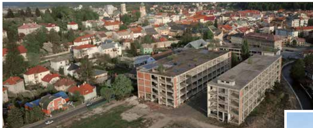
Budova Slovenky pred búraním zachytená zhora