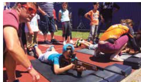
Minulý ročník mal u najmenších úspech

Tento rok sa v Banskej Bystrici môžete tešiť už na štvrtý ročník charitatívnej akcie s názvom Naučme deti športovať. Uskutoční sa dňa 17. júna 2018 v priestoroch Základnej školy Golianova od 10:00 do 13:00 hod. Podujatie podporia aj mnohí úspešní slovenskí športovci, ktorí v tento deň nebudú pri základnej škole chýbať. Účast detí každoročne rastie a veríme, že inak to nebude ani tento rok. Hlavným cieľom akcie je vyzbierať finančnú pomoc pre OZ NOŽIČKA a OZ PONS. Teší nás však aj to, že deťom umožníme stretnúť svoje športové vzory, s ktorými si môžu zasúťažiť a stráviť pekný športový deň so svojimi rodinnými príslušníkmi.