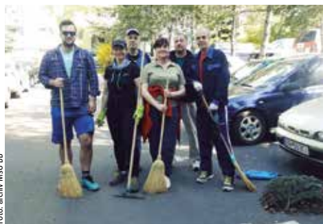
Pomáhali aj obyvatelia z Rudohorskej

Oddelenie odpadového hospodárstva a údržby verejných priestranstiev