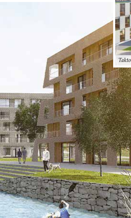
Takto by mal vyzerat' areál Slovenky2

ARKON. Dlhoročnú tradíciu územia bude pripomínať aj názov projektu – SLOVENKA2. Na ploche viac ako štyri hektáre plánuje investor v najbližších rokoch vytvoriť plnohodnotnú mestskú štvrť, v ktorej budú okrem bývania zastúpené aj priestory na prácu, kultúru, nákupy, športové a voľnočasové aktivity. Priestor bude popretkávaný komunitnými záhradami a riečka Bystrica, s vynoveným nábrežím, sa stane súčasťou života mesta. Jedinečné prostredie nového projektu tak podporí komunitný a rodinný spôsob života.