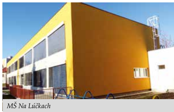
MŠ Na Lúčkach

bariérové vstupy. V nasledujúcom období sa zameriame na podporné aktivity projektov s cieľom ich úspešného finančného ukončenia. Cieľom projektov je zníženie spotreby energie pri prevádzke verejných budov. Zrealizovaním energetických opatrení dosiahneme úsporu energie na vykurovanie, čím sa zabráni neustálemu zvyšovaniu prevádzkových výdavkov na opravu a údržbu týchto materských škôl. Ušetrené finančné prostriedky tak budeme môcť investovať do ďalších rozvojových projektov mesta. Obnova bola financovaná vďaka eurofondom získaným z Operačného programu Kvalita životného prostredia zameraného na zvyšovanie energetickej efektívnosti. Celková oprávnená suma projektu v MŠ Tatranská predstavuje približne 1 079 426 eur, pričom vo verejnom obstarávaní sa podarilo ušetriť cca 275 000 eur. Finančná spoluúčasť mesta je vo výške takmer 55 202 eur a nevyhnutné neoprávnené výdavky sú takmer 19 752 eur. Ďalších 130 000