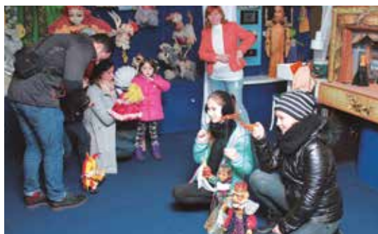
Malí i veľkí sa mohli vrátiť do čias rozprávok