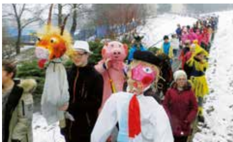
Aj našich najmenších učíme dodržiavať tradície

„Ej veruže každoročne príde táto slávna chvíľa, keď dlhý fašiang na Moskovskej býva!“ A veru bol aj tohto roku. Začiatkom februára deti zo Školského klubu Slniečkovo pri Základnej škole Moskovská so svojimi staršími kamarátmi z druhého stupňa ZŠ, rodičmi a ďalšími dospelákmi poobliekaní v tradičných maskách predviedli fašiangový program na Fončorde. Dlhý sprievod na čele s Turoňom, Slameníkom, prasiatkom, somárom, krojovanými bábkami a ďalšími maskami s doprovodom husličiek kráčal ulicami Banskej Bystrice. Obyvateľom ulíc Tulsá, Moskovská, Internátna a Kyjevské námestie pripomenul, ako sa kedysi oslavovali fašiangy, a že dnešné deti nezabúdajú na kultúrne tradície našich pred-