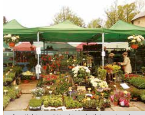
Záhradkári si opäť budú mať z čoho vyberať