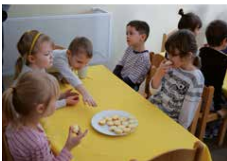
Aj zdravé jedlo zmizlo z tanierov rýchlo

Filozofia tradičných raňajok v základných a materských školách funguje napr. v Slovinsku, Rakúsku i Bavorsku. Riaditeľ SOŠ Pod Bánošom sa pred niekoľkými rokmi inšpiroval práve v Slovinsku, kde školy spolupracujú s miestnymi včelármi, farmármi i pekármami. Tí do škôl dodávajú med, maslo, mlieko a pekárenské výrobky. „Naše slovenské detiedia najlacnejší tovar z hypermarketov. Fakticky, je to prvá generácia, ktorá neje produkty svojich rodičov a začíname to považovať za niečo normálne. Som rád, že na základe múdreho rozhodnutia mesta sme sa stali dodávateľom pre mestské škôlky a detské jasle. Garantujeme čerstvý chlieb, ktorý nie je rozmrazený a nedopeká sa, a tak isto med. Ako jediní na Slovensku sme urobili krok k prirodzeným raňaj-