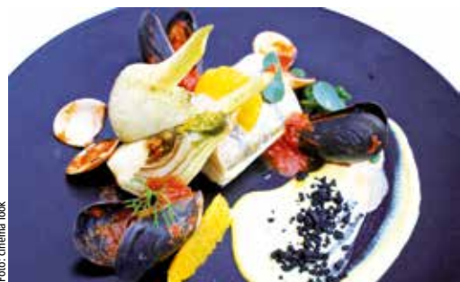
Rozhodcovia budú mať ťažkú úlohu

V poradí už štvrtý ročník súťažno-prezentačnej výstavy s medzinárodnou účasťou sa uskutoční v dňoch 13. – 14. apríla v priestoroch hotela Lux v Banskej Bystrici. Súťaže budú prebiehať v kategóriách varenie naživo: kuchár junior, kuchár senior a poézia v gastronómii. Návštevníci podujatia môžu popri súťažiach vidieť aj zaujímavé sprievodné programy, kde sa budú prezentovať partnerské firmy z oblasti gastronómie a cestovného ruchu. Podujatie slúži ako odbornej, tak i laickej verejnosti. Nebude chýbať ani možnosť degustovať produkty firiem. O nápoje sa postarajú študenti Hotelovej akadémie Banská