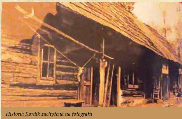
História Kordík zachytená na fotografii

A to pod rôznymi názvami. V roku 1696 ako Kordikov, v roku 1700 pod názvom Kordik. Na základe týchto matričných záznamov sa dá zistiť, že v rokoch 1695 až 1704 tu žilo minimálne osem rodín. Medzi nimi nachádzame priezvisko Kordik. Na začiatku 18. storočia nemala osada Kordíky charakter kompaktného sídla, bol to len zhľuk drevených chatrčí, ktoré sa koncentrovali do dvoch menších, od seba nie veľmi vzdialených osád. Na základe súpisu a popisu osád z roku 1710 boli osady registrované pod názvami Donovall oder Kordik a Szabka. V obidvoch prípadoch boli osady