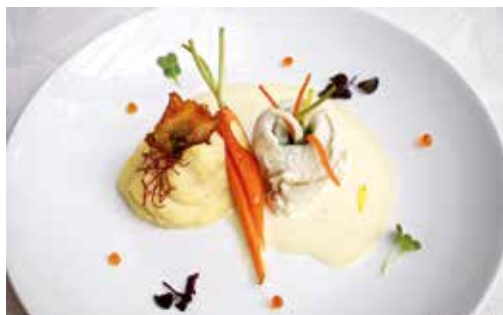
Aj takto môže vyzerať umenie na tanieri