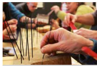
Tvorivá dielňa v Stredoslovenskej galérii