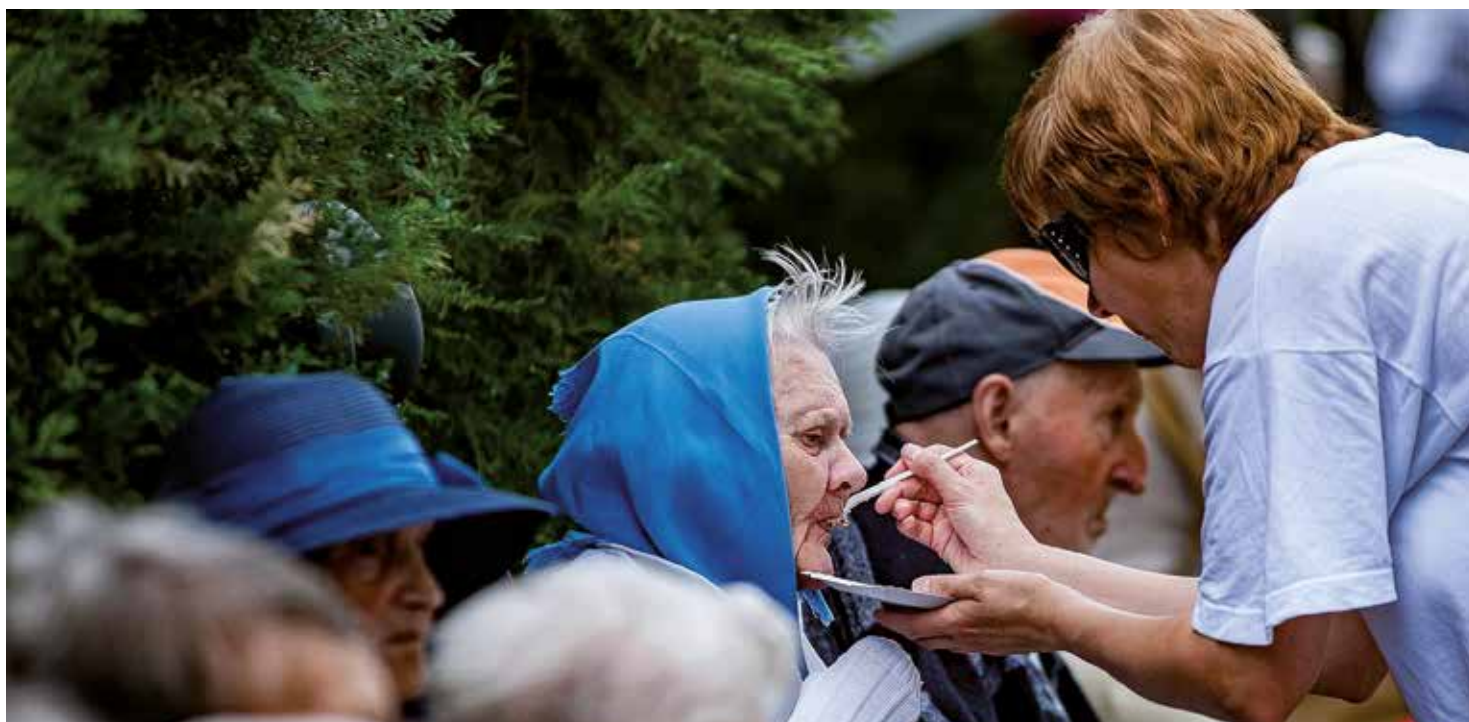
Vyškolené pracovníčky sa vedú odborné postarať o seniorov

Sociálne služby v meste Banská Bystrica sú v rámci Slovenska jedny z najrozvinutejších. Prvé priečky nám patria v kategórii rôznorodosti druhov i foriem poskytovaných služieb. Pozitívom je aj ich dostupnosť pre občanov v prípade odkázanosti na pomoc.