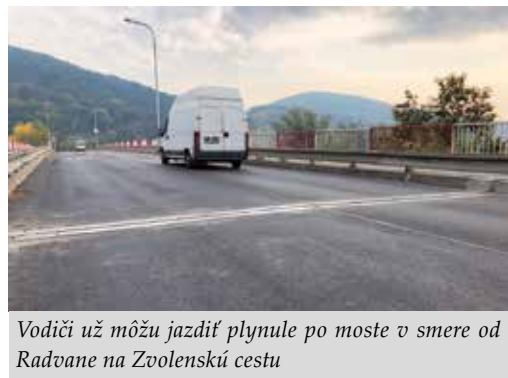
Vodiči už môžu jazdiť plynule po moste v smere od Radvane na Zvolenskú cestu

stavebnej údržby obnovujeme vnútroblok Kpt. Nálepku – Wolkerova v hodnote 57 600 eur. Po obnove chodníkov na Tulskej ulici sa začalo s prácami aj na Moskovskej, a to v objeme 35 000 eur. Nový chodník a obrubníky už majú aj obyvatelia Bagarovej ulice. Nezabúdame ani na okrajové časti. Počas septembra sme v Kremničke obnovili vozovky na Čerešňovej a Brezovej ulici. Na Sládkovičovej ulici 74 – 76 v Podháji sa pracovalo