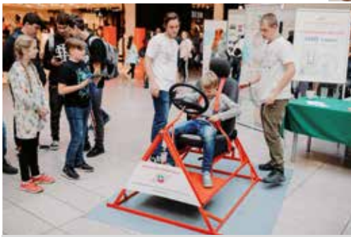
Aj deti si skúsili simuláciu prevrátenia sa v aute

Aj tento rok sa posledný septembrový piatok Banská Bystrica pridala k stovkám miest v 30-tich európskych krajinách, aby ukázala, že veda je zábava. Dvanásť ročník Európskej noci výskumníkov priniesol opäť vedu a výskum bližšie širokej verej-