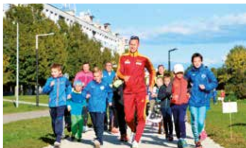
Banskobytrický chodecký míting