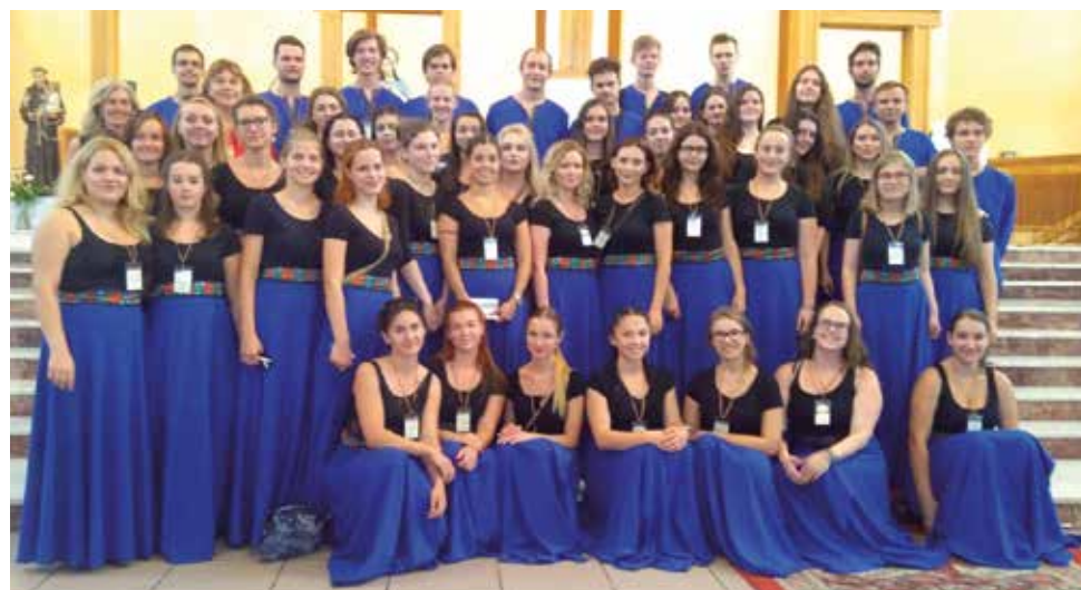
Spevácke zbory po galakonzerte v Rumunsku