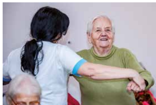
O mnoho starých ľudí sa musia postarať opatrovateľky

sa poskytovala opatrovateľská služba 228 klientom s celkovým počtom 138 635 opatrovateľských hodín a celkové výdavky na túto službu za rok 2017 predstavovali 862 575 eur. Pripravuje sa rozšírenie kapacít denného stacionára a zariadení opatrovateľskej služby. Obyvatelia majú možnosť výberu aj neverejného poskytovateľa sociálnej služby, pre ktorých každoročne mesto vyčleňuje finančné prostriedky zo svojho rozpočtu.