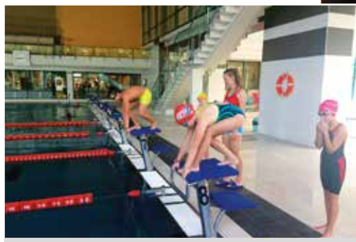
Plavecká štafeta žiakov