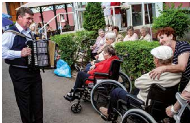
Aj starí ľudia potrebujú zábavu a rozptýlenie

Mesto zameriava pozornosť aj na zraniteľné skupiny obyvateľstva, ktoré nejakým spôsobom prišli o bývanie alebo sú dlhodobo nezamestnaní. V tejto oblasti mesto podporilo a pričínilo sa o udržateľnosť výsledkov projektu s názvom „Od dávok k platenej práci“, kde jedným z výstupov projektu bolo zriadenie neziskovej organizácie Podnik medzitrhu práce – Šanca pre všetkých. Zameriava sa na riešenie dlhodobej nezamestnanosti a viacnásobného znevýhodnenia prostredníctvom