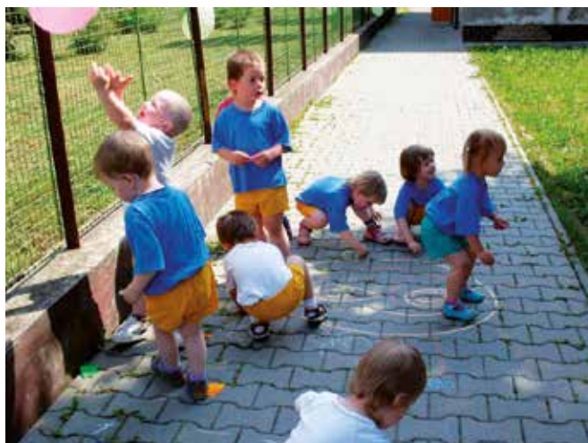
Keď sú rodičia v práci, o deti je dobre postarané