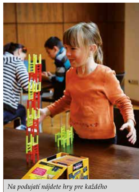
Na podujatí nájdete hry pre každého

Už po šiesty raz sa všetci milovníci hier môžu tešiť na podujatie Hravá Bystrica, ktoré sa uskutoční 21. októbra. Rôzne druhy hier, ktoré si budete môcť nielen vyskúšať, ale ich aj vyhrať, pre Vás pripravila predajňa spoločenských hier iHRYsko spolu s mestom Banská Bystrica.