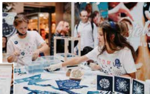
Stánok s ukázkou výroby modrotlače

nosti. Minulý rok si prišlo inovácie, vedecké objavy či rôzne prednášky našich slovenských vedcov pozrieť 20 000 návštevníkov z celého regiónu, no tento rok ich bolo 22 153. Podujatie sa uskutočnilo v priestoroch nákupného centra Europa Shopping Center, kde na návštevníkov čakalo 27 vedeckých stánkov. V nich sa napríklad dozvedeli ako vzniká modrotlač alebo kde