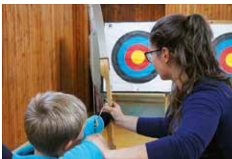
Deti aj dospelí si mohli vyskúšať lukostreľbu

Európsky týždeň športu motivuje mnohých ľudí k zdravému životnému štýlu a podporuje myšlienku aktívneho odpočinku nielen počas tohto týždňa, ale aj v priebehu celého roka. Žiaci a učitelia Základnej školy Sitnianskej 32 sa zapojili do štvrtého ročníka Európskeho týždňa športu a dňa 25. septembra zorganizovali Športový deň pod názvom #BeActive, ktorý bol určený pre širokú verejnosť sídliska Sásová. Pripravených bolo deväť športových disciplín zameraných na rýchlosť, obratnosť a rozvoj silových schopností. Ľudí neodradila