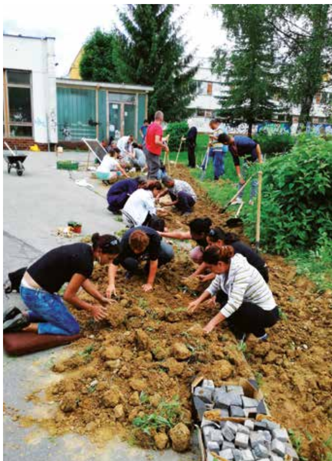
Dlhodobo nezamestnaní pracujúci v Podniku medzitrhu práce