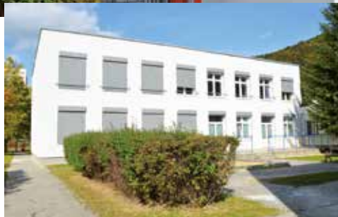
Budova Materskej školy po rekonštrukcii