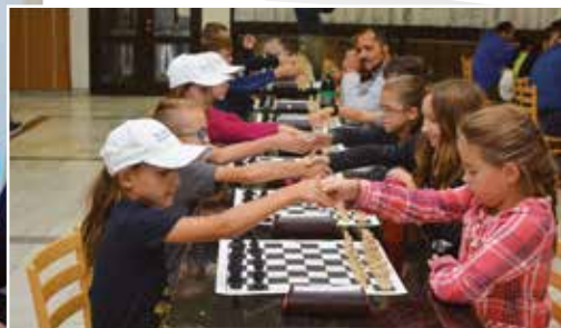
Open BB a Veľká cena mládeže v rapid šachu