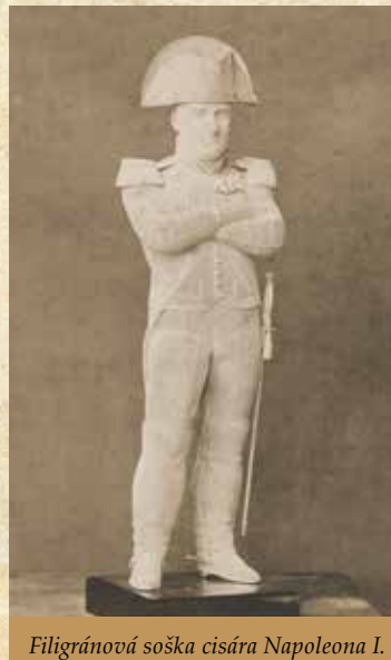
Filigránová soška cisára Napoleona I.

o váhe 32,5 lóta. Do pokladne vložil kapitál 50 zlatých a za dve zvolania cechu zaplatil 2 zlaté.