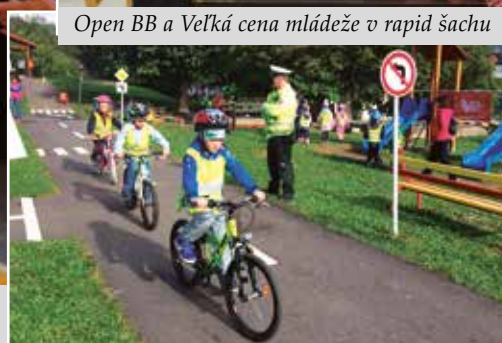
Získaj svoj prvý detský vodičák