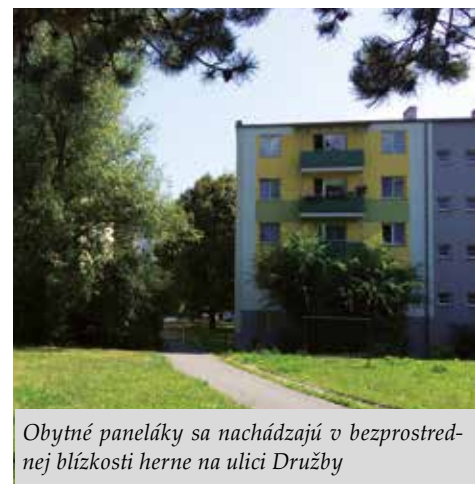
Obytné paneláky sa nachádzajú v bezprostrednej blízkosti herne na ulici Družby