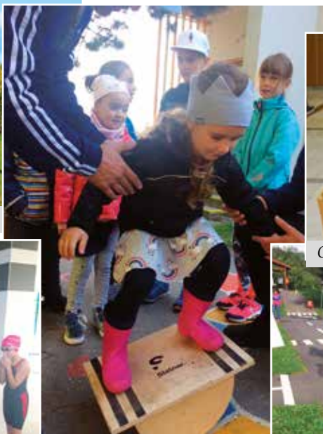
Malá športová škola pre veľkých škôlkarov