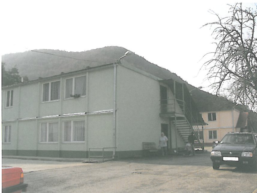
Kotva II. - dočasné bývanie