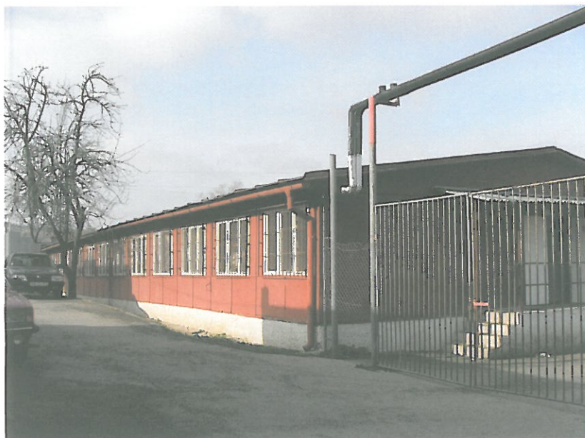
Kotva IV. - núdzové bývanie