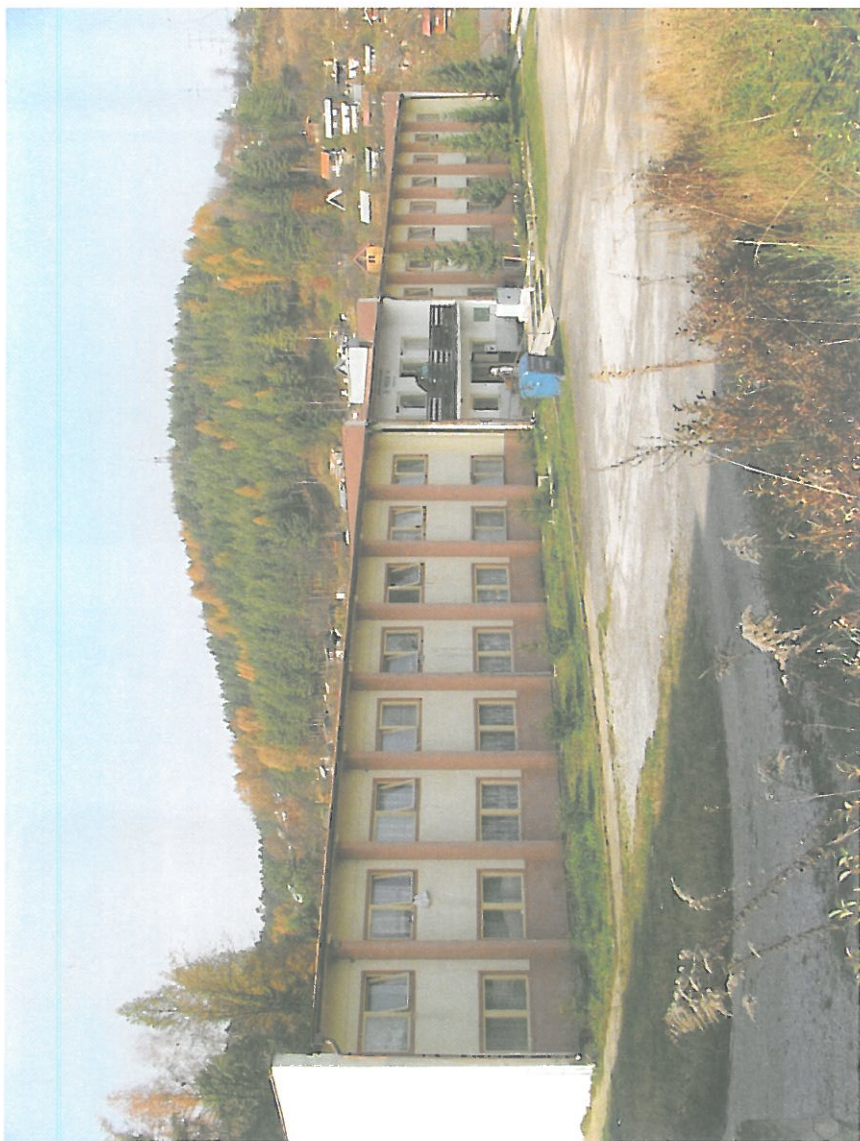
SCHC „ Prístav ”